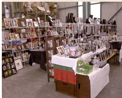
Der Mustertisch (oben) und der Blick in die Lagerhalle (unten)

dem wird im Allgemeinen nicht die nötige Beachtung geschenkt. Doch gerade hier kann sich der initiative Fotohändler, der innovative Fotograf von der Konkurrenz abheben – was im Zeitalter der allgegenwärtigen Digitalknipse(r) nötiger ist denn je. Die Alben und Karten der Positiv Serie lassen sich – auch hier wieder die Chance, sich abzuheben – allesamt auch personalisieren – ist