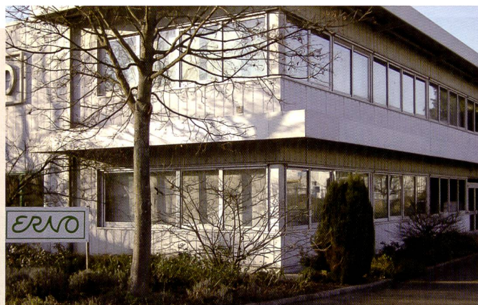
Der Name Erno steht seit 1947 für Service und Qualität im Fotohandel.