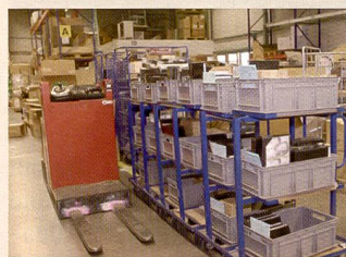
Die Speditionsabteilung kann in Spitzenzeiten bis zu 400 Pakete versenden (links). Rechts: Der neue Showroom