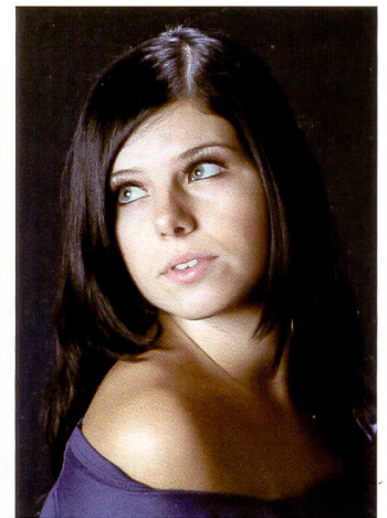
Die gleiche Situation, aber jetzt auf den Rollei Scanfilm aufgenommen. Hier sind dem kontrastreichen Film Grenzen gesetzt.