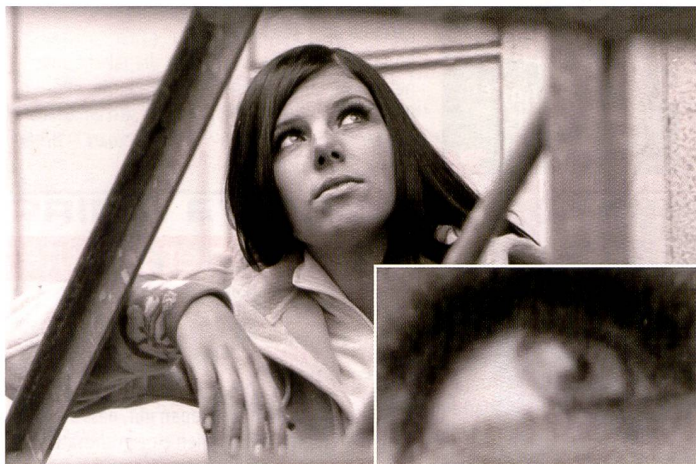
Der Schwarzweissabzug aus dem Heimlabor wirkt sehr ansprechend, und könnte auch gut noch mit einer Tonung versehen werden. Dem Charme einer selbst vergrösserten Schwarzweissaufnahme ist kaum etwas entgegenzusetzen, auch wenn die Schärfe in der Detailansicht nicht besticht.