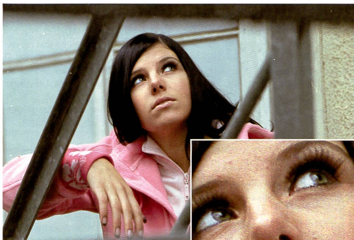
Scan des Negativs mit 150% Vergrösserung: Schöne und ausgewogene Hauttöne und insgesamt angenehme, zurückhaltende Farben. Deutliches Korn. Das Mauerwerk im Hintergrund weist einen leichten Grüntisch auf, hervorgerufen vom Regendach.

Dieser Film wird im E-6 verarbeitet. Der Scanfilm CN 400 PRO ist als Kleinbildfilm mit 12, 24 und 36 Aufnahmen teilweise bereits erhältlich (die 24er Filme sind erst auf den April 2007 angekündigt). Zudem wird er als 120er