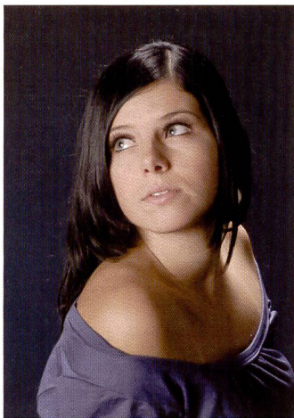
Digitales Porträt im Studio aufgenommen: Sehr homogen in den Farbflächen, einzig die Farbe der Bluse ist leicht verfälscht.

Die Entwicklung des Marktes bringt es mit sich, dass wir auf diesen Seiten meistens über neue Digitalkameras berichten. Doch es gibt durchaus Neuheiten auf dem Gebiet des Films. So hat Fujifilm zur Photokina bekanntgegeben, dass der Diafilm Velvia mit 50 ISO Nennempfindlichkeit unter der Bezeichnung Velvia II