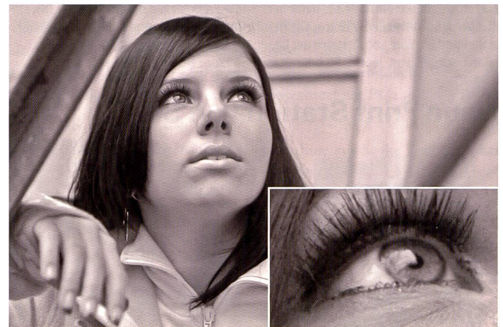
Wird die digitale Aufnahme in ein Schwarzweissbild umgewandelt, bringt das gewisse Probleme mit sich, wenn das Bild anschliessend auf einem Inkjet-Printer ausgegeben werden soll. Für gute Resultate muss unbedingt mit mehreren Schwarztinten gedruckt werden.

dukten, wie dem Portra 400BW. Der Rollei CN 400 Pro eignet sich am besten für Aufnahmen bei leicht diffusem Licht. Für sehr kontrastreiche Bilder, wie etwa unser Studioporträt, ist er weniger geeignet, weil er den Kon-