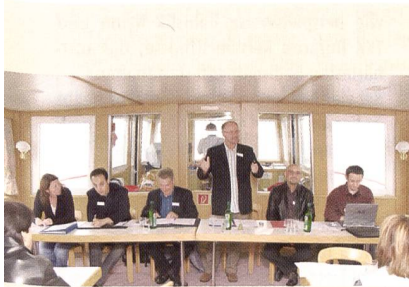
Der Vorstand leitet die GV