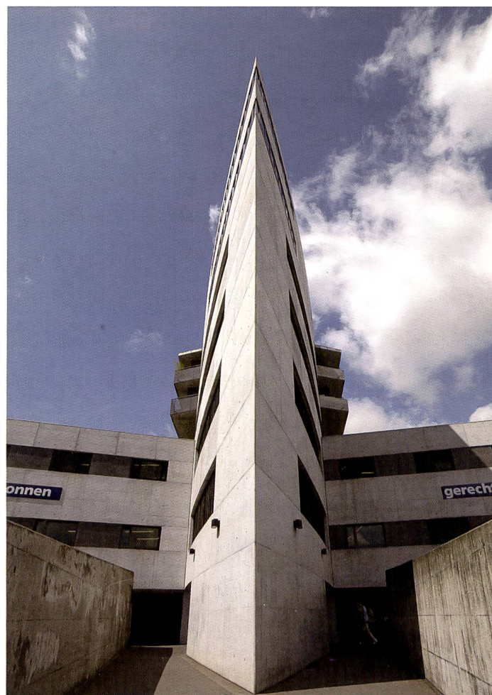
Der Bildwinkel des neuen 28mm Weitwinkelobjektivs verleitet zu Architekturfotos mit spektakulären Perspektiven.

Auch Aufnahmen mit tiefem Kamerastandpunkt sind mit dem bewährten Lichtschacht angenehmer zu bewerkstelligen und die Bildkomposition ist einfacher zu überprüfen (wenn auch mit