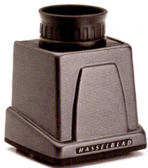
Der neue HVM Lichtschachtsucher für die H-Systemkameras lässt das Hasselblad-Feeling aufkommen.

Die dramatischen Änderungen der Fototechnik haben Fotografen und Hersteller von Kameras und Zubehör gezwungen, umzudenken. Wer im Business erfolgreich sein will, muss sich den veränderten Gegebenheiten anpassen. Im Bereich der Mittelformatkameras ist dies besonders deutlich geworden. Viele Fotografen haben ihre Mittelformat-