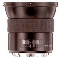
Das neue 28mm Weitwinkelobjektiv wurde speziell für die H3D-Kamera von Hasselblad gerechnet.

Vor einigen Jahren hat sich Hasselblad überraschend vom quadratischen Format verabschiedet