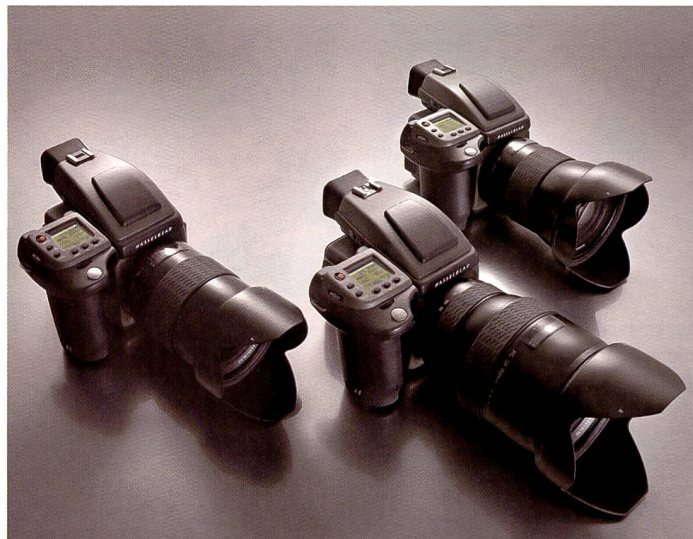
Die Hasselblad H3D ist in drei Versionen erhältlich: Die Kamera mit 22 und 31 Millionen Pixel wird eher in der Porträt- People- und Modofotografie Anwendung finden, während die Architektur-, Stilllife und Landschaftsfotografie vorwiegend die Domäne der 39 Mpixel Version ist.

Gemessen an den Consumer-Kameras sind Neuheiten im Mittelformat selten. Doch die Fortschritte im Bereich der professionellen Kameras sind enorm. Mit der Hasselblad H3D, die als 22-, 31- und 39-MPix Version erhältlich ist, will man abgesprungene Profis wieder ins Boot holen.