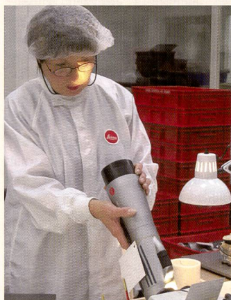
«Fernsicht – Die Weite im Fokus» SF zwei: 24. Juni, 21.30 Uhr VOX: 2. Juli, 23 Uhr

sehen soll, steckt einzig in seinem Kopf. Bis zur Premiere am 24. Juni, 21.30 Uhr, auf SF zwei (Wiederholung 2. Juli, 23 Uhr, VOX) musste noch einiges getan werden: 35 Kassetten – oder 20 bis 24 Stunden – Rohmaterial sollen zu einem Film von etwas über einer halben Stunde werden. Natürlich inklusive dem Archivmaterial. Aber nur schon für das Sichten der Bänder