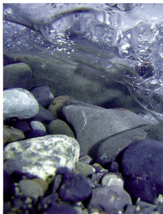
Eisscholle von unten im kalten Gletschersee.

Richtiger Spass kommt aber vor allem mit den Unterwasserprogrammen auf. Die 770 SW ist das erste Kompaktmodell, das wasserdicht bis zu 10 m ist. Nach den ersten zaghaften Versuchen, lassen sich wirklich verblüffende und schöne Bilder fabrizieren. Eine ganz neue Welt erschliesst sich da. Und bald kann man es nicht mehr lassen, die Kamera in jeden Tümpel zu halten und abzudrücken. Die Ausschussquote bleibt allerdings hoch, eine Motivplanung ist unmöglich. Die neue Welt besteht darin, dass Dinge, die mit einer normalen Kamera – und auch mit blossen Auge – verborgen bleiben würden, plötzlich sichtbar gemacht werden können. Einem an sich schon postkartenwürdigen Motiv, wie dem Gletschersee in Jökulsárlón (wo von der Gletscherzunge Eisbrocken bis ins Meer vorstossen) lassen sich so ungewöhnliche Aspekte abgewinnen. Eisschollen unter Wasser – wunderschön; kalte Finger gibts trotzdem. Fazit: Härtetest bestanden. Die Olympus mju 770 SW überzeugt durch die gute Bildqualität, vor allem aber durch ihre «Unerschütterlichkeit». Eine Kamera, die wirklich überall mitgenommen werden kann und verblüffend neue Bildideen eröffnet. Besonders geeignet als Zweitkamera. Der Preis: CHF 628.–.