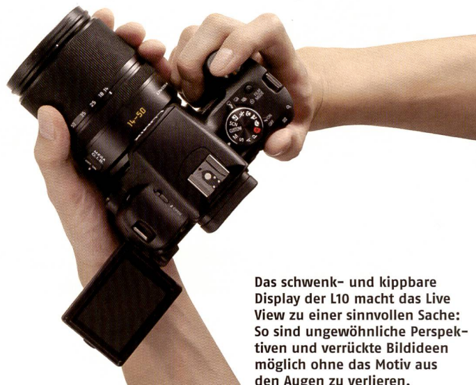
Das schwenk- und kippbare Display der L10 macht das Live View zu einer sinnvollen Sache: So sind ungewöhnliche Perspektiven und verrückte Bildideen möglich ohne das Motiv aus den Augen zu verlieren.

Panasonic bringt seine zweite Four Thirds-Kamera auf den Markt. Die Lumix L10 soll ab Oktober erhältlich sein und den Markt gehörig aufmischen. Ihr wurden viele bekannte und beliebte Funktionen aus der Kompaktklasse eingepflanzt: Ein Novum bei DSLRs ist zum Beispiel die Gesichtserkennung oder auch das gelenkige Display.