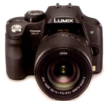
Die L10 mit ihrem 10,1 MPix Live-MOS-Sensor soll Vorteile von Kompakt- und DSLR-Kamera vereinen.

Im Trend bei den Kompaktkameras liegt auch die sogenannte Gesichtserkennung. In der L10 ist diese nun erstmals in einer Spiegelreflexkamera zu finden. Bis zu 15 verschiedene Gesichter kann die Kamera erkennen und automatisch auf diese scharfstellen und die Belichtung anpassen. Für die Erkennung benötigt die L10 das Dreieck von Augen und