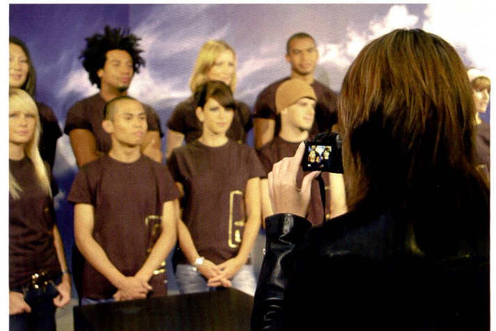
Als erste Spiegelreflexkamera kann die Lumix L10 Gesichter erkennen. Sie stellt automatisch auf bis zu 15 Gesichter scharf und passt die Belichtung an, allerdings nur im Liveview-Modus.

ren kennt, ausgestattet sein, benötigt aber nur so wenig Energie wie ein CMOS-Sensor. Bildqualitäten konnten wir leider nicht überprüfen, da wir eine Kamera der Vor-Produktion in den Händen hielten.