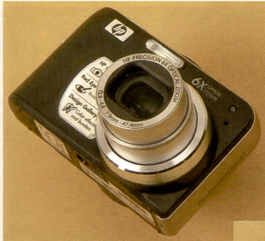
Die Mz67 mit 6-fachem optischem Zoom.

Das Topmodell der M-Linie verfügt über ein sechsfaches optisches Zoom, eine Auflösung von 8 Megapixeln sowie eine breite Palette an Zusatzfunktionen. So sorgen neben verschiedenen Bildmodi der Verwacklungsschutz und die HP Rote-Augen-Korrekturfunktion für gelungene Bilder in jeder Situation.