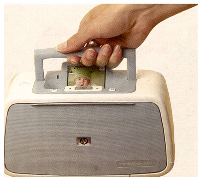
Der A526 ist handlich und weist Steckplätze für Speicherkarten auf.

kunden. Zur Standardausstattung gehören ein interner Speicher von 64 MByte, integrierte Speicherkarten-Steckplätze und ein PictBridge-Anschluss. Auch für den A826 ist ein Bluetooth-Adapter erhältlich. Eine interne Papierzuführung für bis zu 100 Blatt sorgt beim Druck für ausreichend Nachschub. Der neue HP Kompakt-Foto-