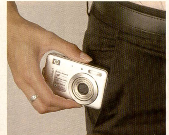
Für die Hosentasche: Die HP Photosmart R742.