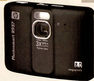
Die R937 ist mit einem Fujinon-Objektiv ausgestattet.

zum Beispiel rote Augen korrigiert werden, die Bilder mit Rahmen versehen oder zum Versand vorbereitet werden. Unter den 13 verschiedenen Aufnahmemodi ist die Theaterfunktion bemerkenswert.