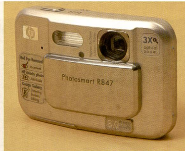
Die R847 ist superflach dank «versenktem» Objektiv.