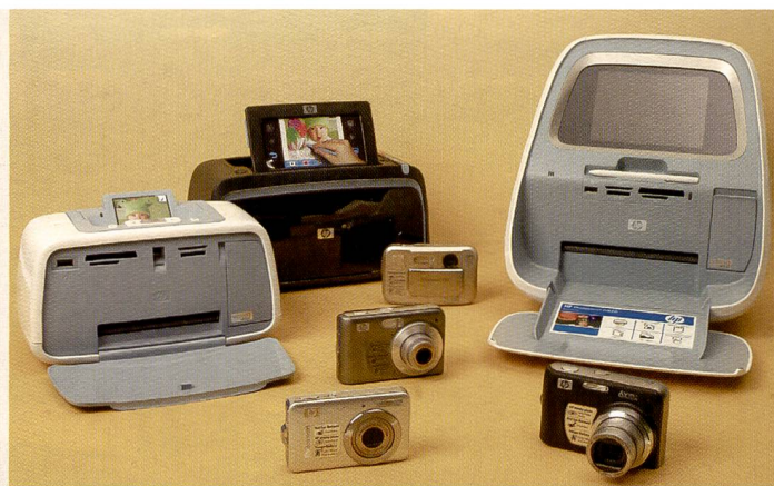
Das aktuelle Sortiment von HP umfasst mobile Drucker und Kompaktkameras mit vielen integrierten Features.