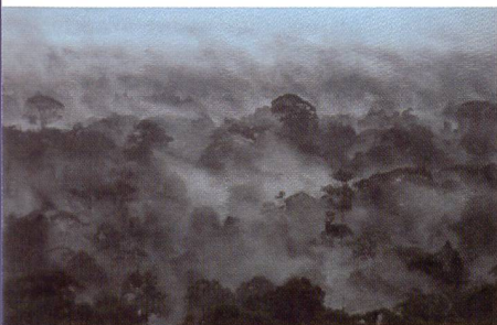
© Günter Ziesler, Tropischer Regenwald, Borneo

Die Fondation Beyeler in Riehen zeigt eine eindrückliche Fotografie-Ausstellung.