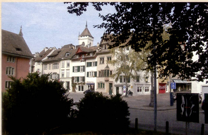
In der Weitwinkel-Aufnahme (grosses Bild) der Fujifilm Finepix Bigjob HD-3W ist eine leichte Überbelichtung festzustellen. Der grosse Weitwinkel (28 mm) ist ein Vorteil für die «Baustellen»-Kamera. In der Teleaufnahme (kleines Bild, 150% Vergrösserung) macht sich ein vergleichsweise starkes Bildrauschen bemerkbar.