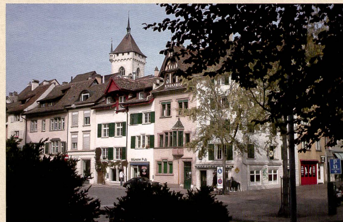
Die Minox DC 6033 WP verfügt nur über eine Festbrennweite, sie lässt lediglich die Möglichkeit eines digitalen Zooms zu. Die Minox fotografiert in warmen Farben, mit Tendenz ins Rötliche. In Schatten und Lichter gehen Details verloren, in den dunkleren Partien ist zudem ein Rauschen feststellbar.