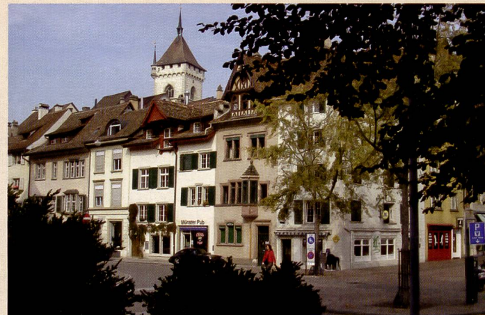
Die Pentax Optio W30 ist die einzige Kamera im Test, die nicht für den «harten Umgang» gebaut wurde. Sie zeigt warme Farben mit Tendenz ins Gelbliche. Die Optio W30 kommt mit dem Dynamikumfang gut zurecht, die Detailzeichnung ist gut. Allerdings muss auch hier ein Bildrauschen festgestellt werden.