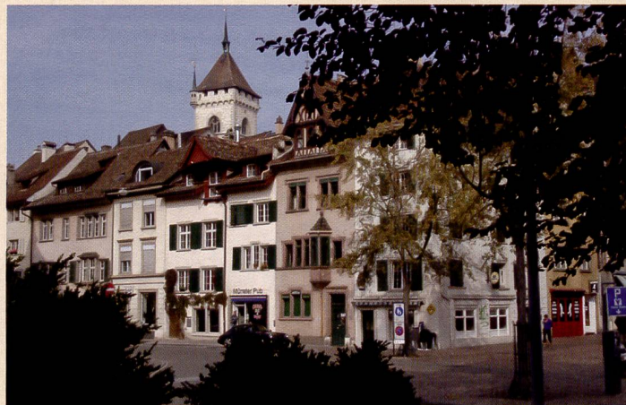
Die Olympus mju 790 SW zeigt neutrale, gute Farben, die sehr nahe am Original sind. In den dunklen Partien (beispielsweise den Büschen im Vordergrund) ist kaum Detailzeichnung vorhanden. Das Rauschverhalten ist dafür vergleichsweise gut – das beste im Test. Farbsäume sind kaum feststellbar.