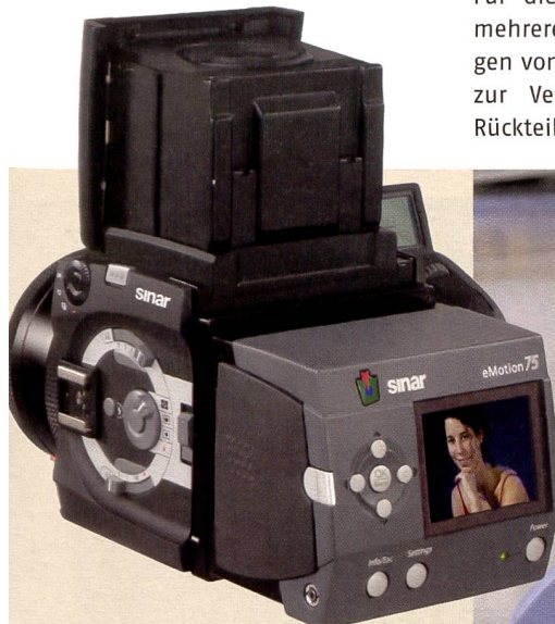
Einfache und logische Handhabung: Die wichtigsten Einstellelemente befinden sich übersichtlich angeordnet auf der linken Kameraseite. Als Zubehör wird Sinar einen Drehrahmen auf den Markt bringen, der die schnelle Umstellung vom Quer- ins Hochformat ermöglicht. Mit der Sinar Hy6-e75 können bis zu 500 Bilder – ohne Computeranbindung – im Rückteil gespeichert werden.

Erstmals bieten drei sich konkurrierende Marken ein Kamerasystem mit einem identischen Grundkonzept an. Dahinter steht der deutsche Technologiekonzern Jenoptik, der auch die Entwicklung leitete und vorfinanzierte. Mitentwickler Sinar hat im Markt etwas Vorsprung und dürfte bereits im November die ersten Kameras der Serienfertigung ausliefern können. Leaf wird ebenfalls mit drei verschiedenen Rückteilen (33, 28 und 22 Mpix) gegen Ende Jahr nachfolgen, wobei die beiden Kameras bis auf die Stromversor-