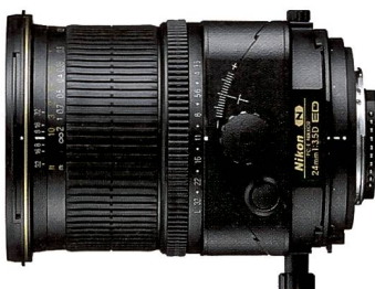
PC-E Nikkor 1:3,5/24 mm D ED T&S in der Detailansicht.

Das 1:2,8/35mm Makro AT-X M35 Pro DX ist nicht nur sehr lichtstark, sondern bietet auch eine Naheinstellgrenze von lediglich 14 cm. Das Frontelement ist zudem mit der neuen «Water