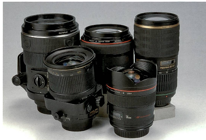
Wir haben – neben anderen – folgende Objektive verwendet: Canon EF 1:1,2/85 mm II USM, PC-E Nikkor 1:3,5/24 mm D ED T&S, Olympus Zuiko Digital 1:2,0/150 mm, Pentax SMC DA 1:2,8/50-135 mm.

Der Fachhandel ist auf Zusatzverkäufe angewiesen. Neben Speicherkarten, Taschen, Stativen, Blitzgeräten und vielem anderem, sind Objektive aber nicht nur ein wichtiger Umsatzträger sondern auch ein oft unterschätzter Qualitätsfaktor.