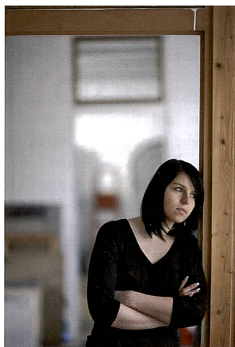
Hier wirkte der Spezialist für Available Light Fotografie, das Canon EF 1:1,2/85 mm L II USM.

Neben den Abbildungseigenschaften haben die Pentax Ingenieure auch die mechanischen Eigenschaften der Objektiv nicht aus den Augen verloren. So sorgen die Ultraschallmotoren