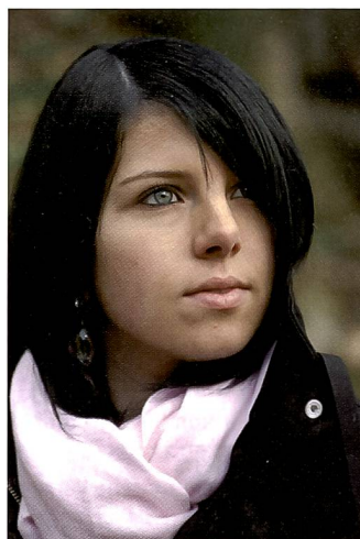
Auch mit dem lichtstarken Pentax SMC DA 1:2,8/50-135 mm ergeben sich schöne Unschärfen.

(Supersonic-Motoren) in den Objektiven für einen leisen und schnellen Autofokus-Antrieb. Daneben sind beide Objektiv durch entsprechende Dichtungen wetterfest und sicher gegen eindringenden Staub geschützt. Für die Vergütung der Frontlinsen verwendet Pentax spezielle Fluorid Verbindungen, die SP - «Super Protect» genannt werden. Hierbei wird die Frontlinse mit einer Spezialbeschichtung vergütet. Diese Nano-Technologie schützt die Frontlinse vor Staub, Fingerabdrücken oder fetthaltigen Rückständen. Im Bedarfsfall lassen sich solche Verunreinigungen problemlos entfernen.