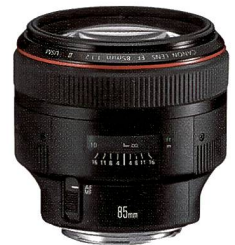
Canon EF 1:1,2/85 mm II USM: Spezialist für Available Light.

Auf den Punkt gebracht bedeutet dies: Festbrennweiten sind die Spezialisten mit Spitzennoten in Qualität und eher durchschnittlichen Werten bei Universalität. Zoomobjektive sind die Universalisten, die mit einem Objektiv viele Anforderungen abdecken, aber bei der Bildqualität, je nach Typ, eher durchschnittliche Bildqualität liefern.