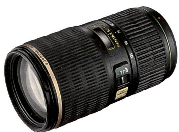
Pentax SMC DA 1:2,8/50-135 mm Zoomobjektiv für die K20D.

ter zwei ED-Glaselemente, drei asphärische Linsenelemente und eine spezielle Vergütung sorgen für ein sehr gutes Kontrastverhalten, eine durchgängige Scharfzeichnung bis in den Randbereich und eine besonders klare Wiedergabe feinsten Details.