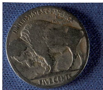
Makroaufnahme mit dem AF-S 1:2,8/60 mm G ED Mikro Nikkor.

Blendenreflexen und Streulicht, indem sie Licht absorbiert, das von internen Linsen und Sensoren einer digitalen Kamera zurückgeworfen wird. Das Objektiv fokussiert per Ring-USM. Die Scharfstellung erfolgt durch die Ultraschallschwingun-