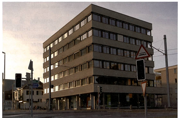
Mit der Shiftbewegung des PC-E Nikkor 1:3,5/24 mm D ED T&S wird erreicht, dass die parallelen Linien erhalten bleiben. Bei Gebäuden über drei Stockwerken sollte nicht voll korrigiert werden, es wirkt unnatürlich.

Blendenreflexen und Streulicht, indem sie Licht absorbiert, das von internen Linsen und Sensoren einer digitalen Kamera zurückgeworfen wird. Das Objektiv fokussiert per Ring-USM. Die Scharfstellung erfolgt durch die Ultraschallschwingun-