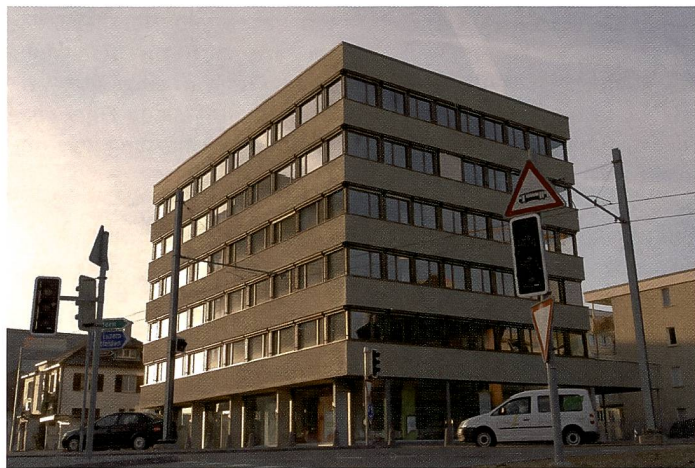
Ein Phänomen wie es häufig bei Aufnahmen von Gebäuden auftritt: Die Kamera wird nach oben verkantet, dadurch «stürzen» die Linien, sie verjüngen sich stark nach oben, das Gebäude «fällt» nach hinten.

mit dem SP AF 1:3,5-4,5/10-24 mm Di II LD Aspherical (IF) entgegen. Dieses Objektiv, exklusiv für digitale Spiegelreflexkameras mit APS-C Sensoren, ist eine verbesserte Weiterentwicklung des bekannten Tamron 11-18mm und wartet mit höherer Leistung und besseren Spezifikationen auf. Der Bereich erstreckt sich vom Weitwinkel in den Ultra-Weitwinkelbereich hinein. Die Lichtstärke wurde von 1:4,5-5,6 auf 1:3,5-4,5 verbessert bei gleichem Filterdurchmesser von 77 mm. Leider stand bis Redaktionsschluss noch kein Muster zur