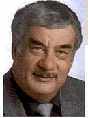
Urs Tillmanns Fotograf, Fachpublizist und Herausgeber von Fotointern

Spot auf die photokina. Die Weltmesse des Bildes erwartet wiederum Zehntausende Besucher, die sich an den Ständen drängeln, um die brisanten Neuheiten anzusehen und anzufassen. Fachgespräche werden geführt, Geschäfte abgeschlossen.