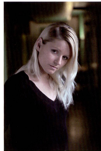
Absence quasi totale de bruit avec l'EOS 5D de Canon à 800 ISO. Couleurs assez soutenues en mode standard.

«noir et blanc». Tout comme Nikon pour le D200, Canon reste fidèle pour l'EOS 5D à son concept de positionnement des éléments de commande. Aucune surprise à cet égard, même si le bouton de