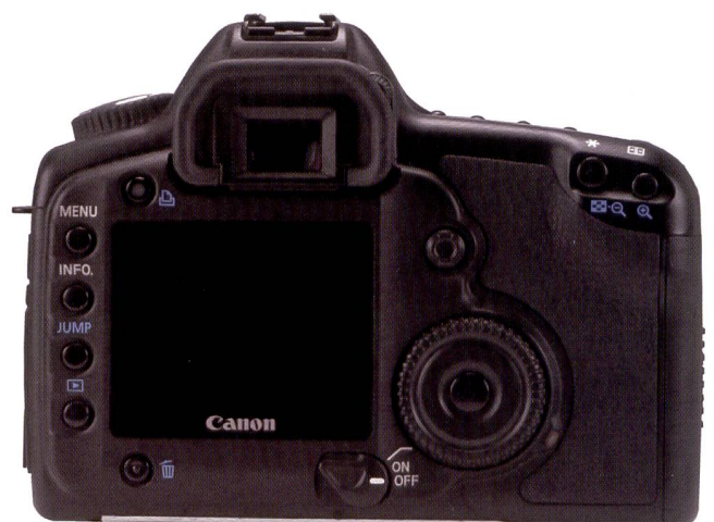
Les éléments de commande avec la molette arrière chez Canon.

Color Efex Pro 2.0 etc.). Dans la pratique, le D200 a déjà prouvé qu'il délivrait des tons chair agréables et plaisants en conditions de luminosité normale tout comme en studio. Les portraits présentés ci-dessous n'ont pas été retouchés, il s'agit de fichiers JPEG provenant directement du boîtier. Ces résultats ont été obtenus avec un réglage «portrait» dans le menu «optimisation de l'image», qui propose, en plus de «portrait», six préréglages différents: «normal», «adouci», «brillant», «intense», «défini par utilisateur»,