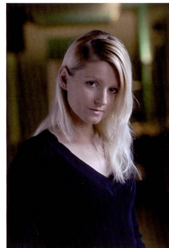
Le portrait réalisé avec le D200 de Nikon ne révèle aucun bruit même à 400 ISO. Tons chair agréables grâce au mode «portrait».

galement d'éliminer les poussières, de réduire le bruit et de corriger les distorsions des objectifs Fisheye. Plusieurs modules d'extension sont disponibles pour étoffer le logiciel Nikon (nik