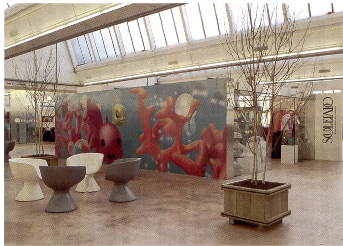
Même lors de prises de vue en intérieur, le ZD maîtrise sans problème ces conditions de luminosité difficiles. L'appareil, polyvalent par excellence, convient pour divers domaines de prise de vues!