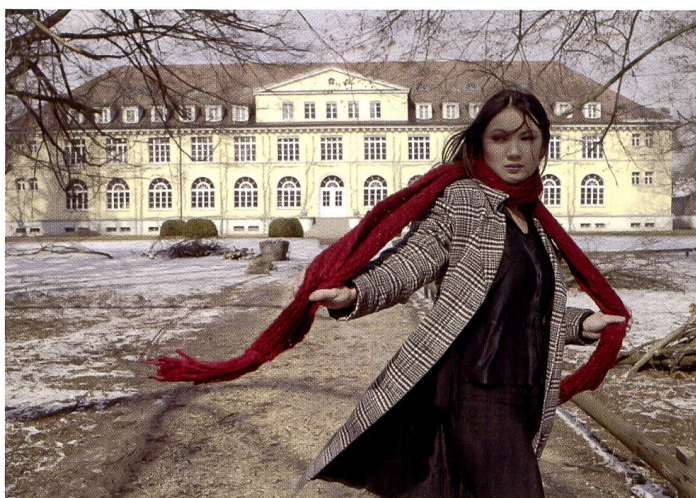
Mamiya renonce sciemment au filtre passe-bas. Malgré tout, le moiré est quasiment indécélable même sur ce sujet difficile (manteau), le résultat étant craquant et agréablement contrasté même sans correction de la netteté.

sont ainsi d'une netteté hors pair même sans masquage des flous. Si l'utilisateur souhaite faire appel à un filtre passe-bas pour obtenir des effets moirés, il lui suffit d'introduire le filtre optionnel dans la fente prévue à cet effet (!). Bon point pour le logiciel fourni, baptisé Mamiya Digital Photo Studio, il est compatible avec les systèmes d'exploitation Windows. L'installation s'effectue rapidement et sans problème. Les images s'affichent dans une fenêtre dédiée, le défilement est piloté par les touches avant et arrière.