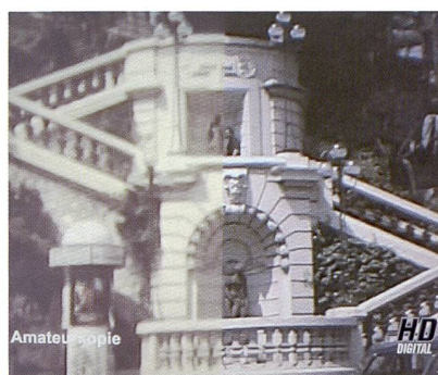
For Video: une qualité contrôlée dans la production de DVD à partir de pellicules.

dehors des tarifs pratiqués par les marques d'origine, les prix dégagent une marge intéressante pour le commerçant. Pro Ciné commercialise aussi une poignée d'alimentation à déclencheur vertical conçue par Hähnel. Directement intégrable au Nikon D70s, elle confère une prise en main plus équilibrée du boîtier et peut accueillir une deuxième batterie pour photographier encore plus longtemps. Pro Ciné propose également deux chargeurs de marque Hähnel, un top modèle ultra rapide (1 h) avec auto-adaptateur et un modèle universel plus rudimentaire. Un service de livraison rapide le lendemain vient arrondir la gamme de prestations.