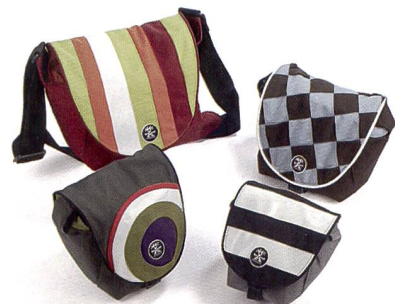
Des bagages culte venus d'Australie: Crumpler.

archivage de photos sur CD ou DVD sous forme de diaporamas, création de DVD avec programmation de menu, récupération d'images numériques à partir de cartes mémoires abîmées, horodatage, télémontage de vidéos, copies vidéo, copies vidéo en grandes séries, conversion de vidéos et DVD de et vers les normes PAL, SECAM ou NTSC, montage vidéo linéaire et non linéaire, production de DVD, copies de DC et DVD en grandes séries, édition d'archives et vente d'équipement vidéo professionnel. Un DVD de démonstration est disponible sur demande. Pro Ciné a aussi intégré dans son offre la ligne très tendance de bagagerie Crumpler, l'enlèvement de déchets chimiques pour Minilabs et tout récemment une large gamme de piles rechargeables développées et fabriquées par la Société Hähnel Industries Ltd.