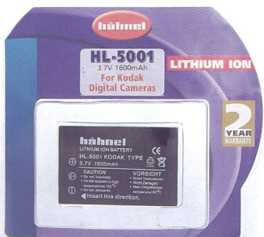
Alternative bon marché de bonne qualité: batteries Hähnel.