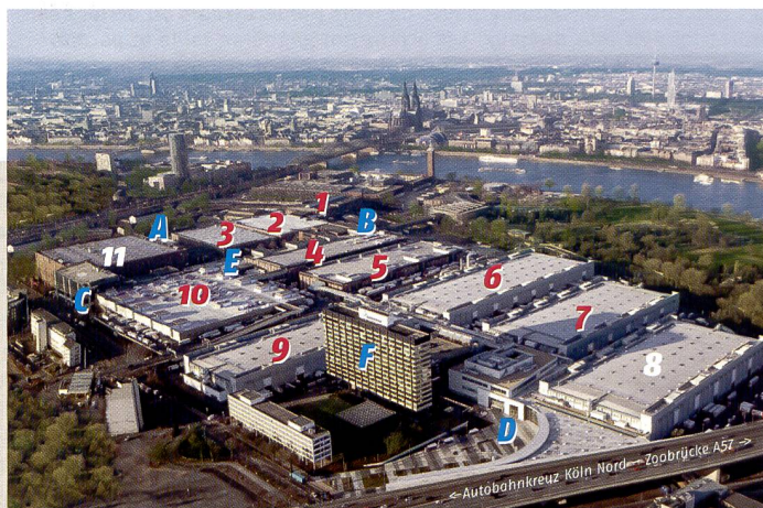
Hall 1: Visual Gallery, programme d'accompagnement; halls 2, 3, 4.2, 5, 6: prise de vues/équipement; hall 4.1: retouche des images; hall 6: sauvegarde; hall 7: accessoires, consommables; hall 9: présentation; halls 4.1, 10: édition des images, services; halls 8, 11: non utilisés.