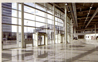
Aménagement spacieux de l'entrée nord