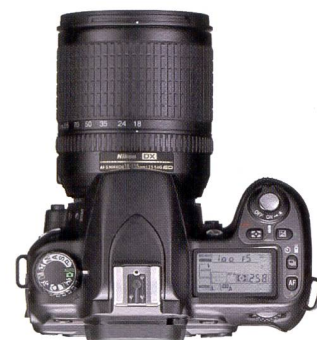
Le dessus du boîtier est clairement structuré.

La fonction «D-Lighting» corrige automatiquement la luminosité et le contraste dans les zones de l'image surexposées pour ne conserver que les tons moyens. La fonction avancée de «correction des yeux rouges» intégrée au boîtier élimine automatiquement cet effet indésirable. La fonction «Coupe» permet d'alléger les fichiers d'image pour pouvoir les