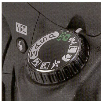
Pour les utilisateurs amateurs, le D80 propose des modes de prise de vues simples sur la molette de réglage centrale.

L'option «Montage» donne accès à des trucages p. ex. la superposition de deux fichiers RAW (NEF) pour créer une seule image. Parmi les autres options d'édition, le photographe peut choisir «Filtres» («monochrome», «sépia» et «bleuté») et «Effets» («Skylight» (dominante rosée), «ton chaud»