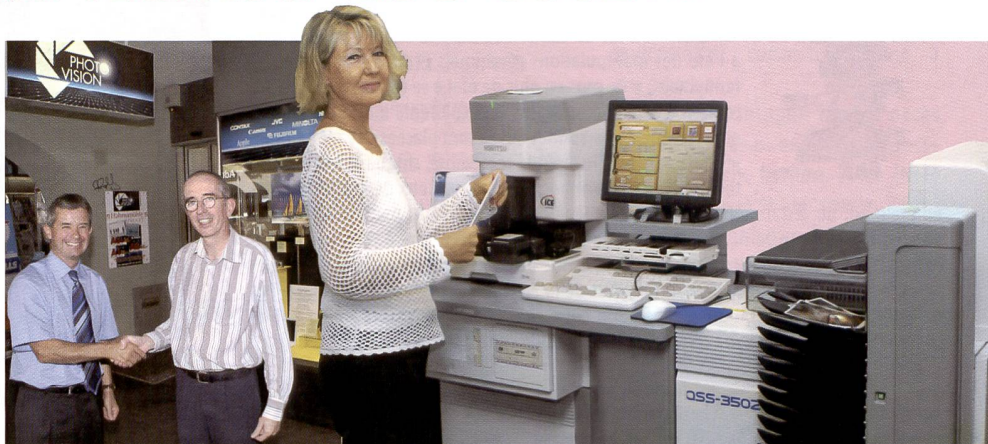
Berne. Le nouveau Minilab NORITSU QSS-3502 installé dans le magasin principal de Photovision SA dans la Marktgasse s'avère être un produit universel rentable pour tous les tirages à partir de données analogiques et numériques.

Cela dépend aussi des réglages de l'appareil, mais nous avons constaté que le NORITSU QSS-3502 restitue les couleurs originales très fidèlement et avec beaucoup de brillance. Les couleurs sont telles que nos clients le souhaitent et non pas