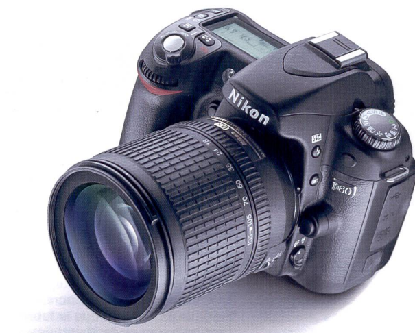
Avec le D80, Nikon entre dans la catégorie des reflex numériques pour amateurs de 10 mégapixels. Sur le plan technique, l'appareil repose sur le D70s.

Pour ceux qui préfèrent contrôler manuellement la balance des blancs et se passer du mode automatique, le D80 offre un choix de six modes d'éclairage spécifiques parfaitement adaptés à la plupart des situations. En plus de ces options, il est possible de mesurer manuellement la température de couleurs en utilisant un objet blanc ou gris comme référence. Le système AF du D80 offre un autofocus sur 11 zones qui assure une mémorisation rapide et précise de la mise au point quelles que soient les conditions de prise de vue. Il est non seulement capable d'utiliser individuellement chacune des 11 zones de mise au