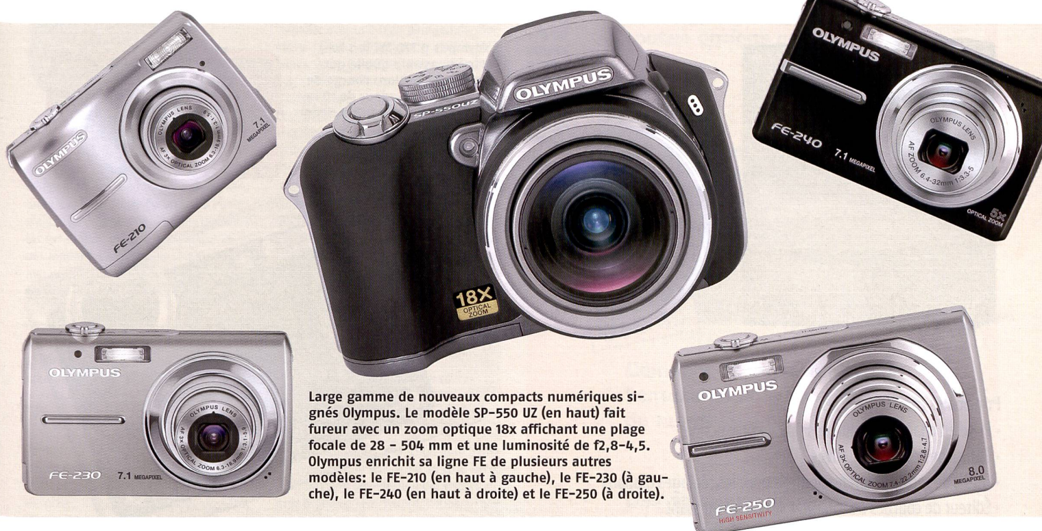
Large gamme de nouveaux compacts numériques signés Olympus. Le modèle SP-550 UZ (en haut) fait fureur avec un zoom optique 18x affichant une plage focale de 28 - 504 mm et une luminosité de f2,8-4,5. Olympus enrichit sa ligne FE de plusieurs autres modèles: le FE-210 (en haut à gauche), le FE-230 (à gauche), le FE-240 (en haut à droite) et le FE-250 (à droite).

Pour sauvegarder les images, l'appareil dispose d'une mémoire interne et d'un compartiment pour cartes xD-Picture. Tous les nouveaux modèles de la série FE présentés ici sont compatibles avec les cartes xD-Picture.