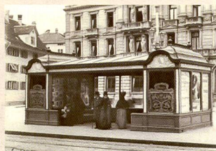
Halle d'attente du tram au Paradeplatz vers 1900.

De précieux originaux issus des archives d'histoire architecturale montrent le visage d'une ville au seuil du 20ème siècle. Venez découvrir un pan de l'histoire contemporaine. Schweizerisches Landesmuseum, Museumstrasse 2, 8023 Zurich, Tél. 044 218 65 11 Info tél. 044 218 65 65, www.musee-suisse.com, ouvert du mar au dim, 10 h – 17 h.