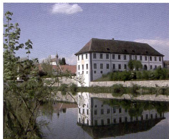
La fonction D-Lighting du Nikon Coolpix débouche les ombres insuffisamment éclairées. En bonus: l'assistant panorama.

tanément la molette de réglage pour afficher les différents modes de prise de vue proposés: Portrait-AF, Portrait, Paysage, Sport, Nuit et Crépuscule, Coucher de soleil, Plage, Neige, Documents, Feu d'artifice et Musée. L'assistant-panorama sauvegarde une version de la première photo qui transparaît légèrement. Le photographe peut ainsi chercher le point où la photo déjà prise recoupe le second cliché.