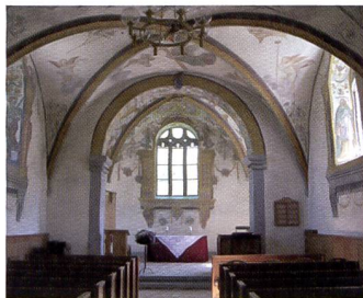
Les modes de prises de vue du G7 comportent une option «Musée» pour réussir de superbes clichés en intérieur.

bouchées. Comparable à fonction contraste/luminosité de Photoshop, elle opère directement dans l'appareil et se limite uniquement aux ombres.