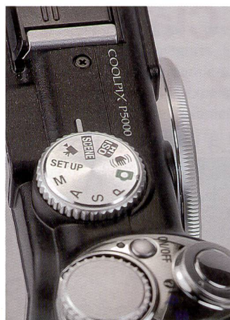
Le Nikons P5000 mise sur une molette de réglage centrale.

La stabilisation d'image Nikon bénéficie aussi à la fonction vidéo: les clips d'excellente qualité sont exempts de secousses et de flous.