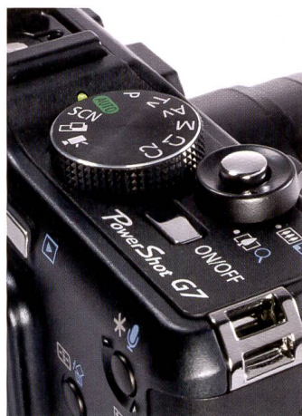
La molette de réglage du Canon G7 est d'apparence classique.

Le gainage de cuir confère à l'appareil une touche très noble. La poignée ergonomique offre une prise en main confortable et sûre. Le gainage présente une texture inspirée du cuir. L'objectif du Coolpix affiche une plage zoom plus modeste que la concurrence. Le zoom 3,5x équivaut tout de même à une plage de 35 à 126 mm permettant de faire face à toutes les situations courantes. Cette plage peut être étendue grâce aux bonnettes disponibles en option. Nikon propose pour le Coolpix P5000 deux bonnettes d'objectifs qui poussent la focale jusqu'à 24 mm dans la plage grande angle ou jusqu'à 378 mm dans la plage télé (équivalent petit format).