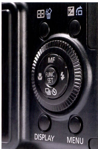
La face arrière du Canon G7 évoque un poste de commandement.

Quand on a le choix, on a forcément aussi l'embarras du choix: Canon et Nikon présentent des appareils très séduisants, à la pointe de la technique et au design extrêmement attractif. Canon marque des points avec sa plage zoom étendue tandis que Nikon joue la carte de la compacité.