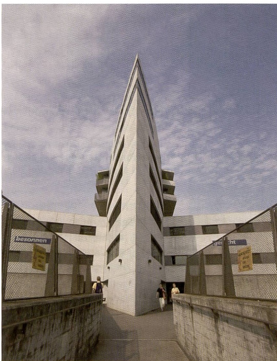
La comparaison révèle le grand angle d'image de l'objectif 28 mm signé Mamiya. Il équivaut à 17 mm environ en format 24x36.

Tout compte fait, le dos ZD-Back est un produit solide qui permet d'entrer dans l'univers de la photographie moyen format à un prix avantageux. Il est commercialisé seul ou en kit avec un Mamiya 645 AFDII et un objectif standard f2,8/80 mm à un prix de 15 990 francs (hors TVA).