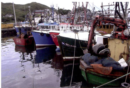
Image originale directement issue de l'appareil et sans passage par l'imprimant et le scanner en guise de référence pour évaluer les photos.

La palme de l'agacement revient à la Kodak G610 car l'utilisateur recherche en vain une fente pour