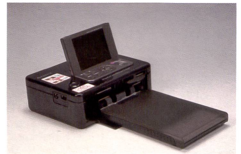
Simple, belle et rapide: le modèle Sony ne met que 45 secondes pour imprimer la photo.