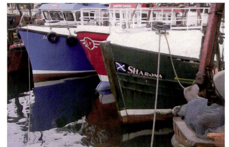
La Picturemate fait mouche dans les parties sombres; aucune autre imprimante testée n'a pu mieux faire en termes de piqué des ombres.

selon le même principe. La Panasonic PX20 est la seule imprimante sur laquelle cette cartouche coince légèrement de sorte qu'il faut malgré tout regarder les illustrations de la notice.