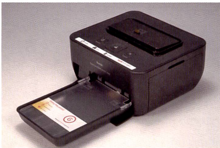
Le modèle peu coûteux Kodak G610 révèle ses atouts en combinaison avec un appareil photo Kodak et dans l'échange simplifié des données.

La photo provenant de la Panasonic PX20 semble dater de plusieurs années parce qu'elle pa-