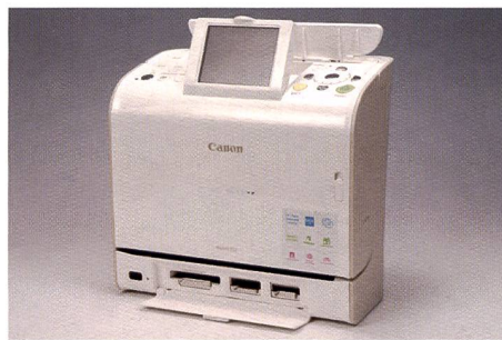
Encombrement réduit pour la Canon Selphy ES2: elle «pousse en hauteur» et se distingue par son design blanc discret et sa connectivité.