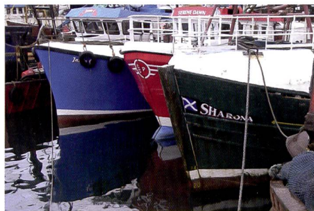
Un extrait à 100% de la photo. Il a été choisi de manière à pouvoir évaluer les couleurs et la dynamique.