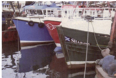
La photo faite avec le modèle Panasonic révèle des couleurs plutôt plates, les contrastes laissent plutôt à désirer.