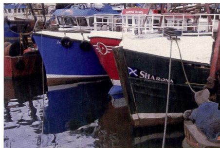
La photo numérisée par l'imprimante Canon révèle des couleurs très vives qui sont plus chaudes que sur la photo originale.