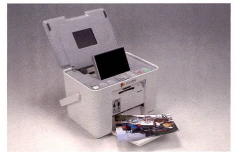
L'Epson Picturemate PM 260 au «design cubique» fait confiance à la technologie jet d'encre et bat ainsi le record de vitesse.