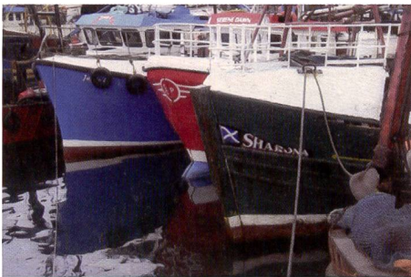
Le tirage de la Kodak G610 affiche de très bonnes valeurs colorimétriques. La plage de contraste est bien restituée elle aussi.