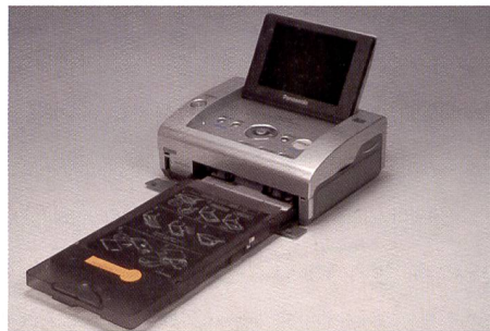
L'imprimante Panasonic PX20 est la plus petite du lot et dispose néanmoins d'un écran offrant une diagonale de 9,1 cm.