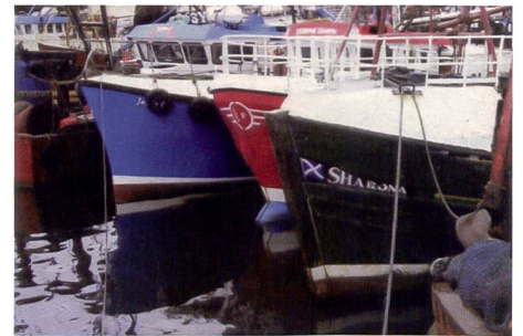
Certains détails passent à la trappe sur la photo imprimée avec le modèle Sony, mais le résultat est très correct par ailleurs.

prend en charge le plus grand nombre de cartes mémoire. L'imprimante Sony n'accepte pas les cartes xD, le modèle Panasonic PX20 refuse les cartes CF également.