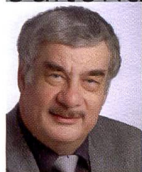
Urs Tillmanns Photographe, journaliste spécialisé et éditeur de Fotointern

Tous les fabricants se dépêchent d'annoncer leurs nouveautés de printemps juste avant la PMA, le salon de la photographie le plus important des Etats-Unis, alors même qu'ils ignorent souvent quand ces produits seront lancés sur le marché. Malgré la CES, l'IFA et d'autres salons de l'informatique et de l'électronique grand public, la PMA à Las Vegas et surtout la Photokina à Cologne (23 au 28 septembre) sont les salons de nouveautés les plus importants de la branche. Cette année, la PMA a commencé plus tôt que d'habitude, le 31 janvier plus exactement, ce qui ne collait pas du tout avec notre planning de publication. Pour cette édition, Werner Rolli nous a envoyé ses articles quasiment en direct depuis Las Vegas. Mais l'article que nous publions dans ce numéro n'est qu'un amuse-bouche car Werner Rolli rapportera encore d'autres découvertes dans ses valises que nous présenterons dans notre prochaine édition de mars. A en juger par les nouveautés de la PMA l'année sera passionnante, avec de nombreux nouveaux reflex, des objectifs fantastiques et de nombreux périphériques utiles qui rendent la photographie encore plus captivante.