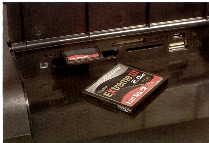
Lorsque vous achetez un cadre photo numérique, assurez-vous que votre type de carte mémoire est soutenu. Veillez notamment aussi à la présence d'un port USB.

Par sa taille et sa résolution élevée, le DigiFrame 1500 convient particulièrement pour les points de vente. Les écrans sont pilotables à distance par une télécommande infrarouge. Seules les photos au format JPEG sont prises en charge (jusqu'à une résolution de 12 mégapixels par le DigiFrame 1020 et de 16 mégapixels par son grand frère). La mémoire interne bénéficie d'une capacité de 128 mégaoctets. Les cadres sont compatibles avec tous les types de cartes mémoire (y compris les clés USB). L'utilisation est très facile, le contraste, la tonalité, la luminosité et la