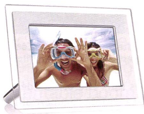
Le Philips PhotoFrame offre dix pouces et 720 x 480 pixels.

lisateurs détestant la routine, une présentation des images est proposée sous forme de collage. La mémoire interne a une capacité de 128 mégaoctets. Le cadre possède deux lecteurs de cartes (avec prise en charge de tous les types courants) pour permettre la