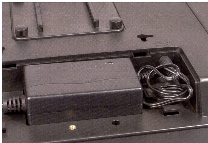
Ne négligez pas les détails lors de l'achat d'un cadre photo numérique. Il est rare de pouvoir se passer d'un câble d'alimentation, mais dans le cas présent, p.ex., le bloc inesthétique peut être dissimulé dans le cadre.

copie de photos d'une carte à l'autre. Les images peuvent également être importées via un port USB. Le Philips PhotoFrame 10FF2M4 fonctionne sur secteur ou sur batterie. L'autonomie de batterie indiquée par le fabricant atteint une heure.