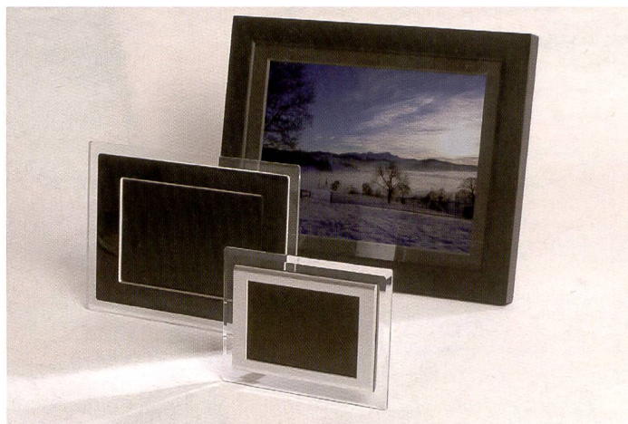
Des cadres photo numériques dans toutes les tailles et variantes sont des idées de plus en plus prisées pour la présentation de photos chez soi ou au magasin. Sur la photo, des cadres de Braun, Philips et Jobo.

Même si certains cadres photo numériques prennent en charge le transfert d'image sans fil, tous doivent tôt ou tard être branchés pour faire le plein d'énergie. Ces accessoires design élégants connaissent un véritable boom. Mais comment faire le bon choix? Voici un petit récapitulatif des modèles proposés par différents fabricants.