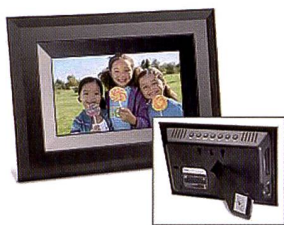
Le cadre Kodak EX 1011 propose des fonctions sans fil.

Commercialisé depuis plus longtemps, le Kodak Easyshare EX 1011 est un cadre photo doté d'un écran TFT 10 pouces au for-