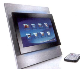
Design futuriste pour le Toshiba DPF7X-SE.

te est compatible avec tous les formats. Les cadres photo reconnaissent également le sens de prise de vue des images et adaptent automatiquement le sens d'affichage. En option, un adaptateur Bluetooth est proposé pour le V700 et le V900 afin de transférer à distance les photos, p. ex. à partir d'un téléphone portable. Les cadres photo seront commercialisés dès mai à un prix de CHF 399.- (V900), CHF 319.- (V700) et CHF 249.- (D70).