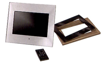
Le modèle 10,22 pouces de Hama existe aussi avec un cadre en bois

positor. Le cadre possède également une mémoire interne (128 Mo). D'une résolution de 800 x