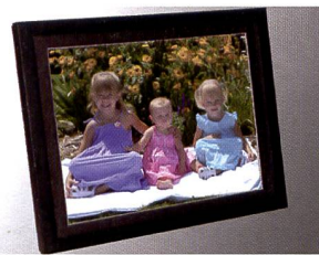
Le cadre de 15 pouces de Compositor est distribué par Fujifilm.

ques auprès de deux fournisseurs différents et propose ainsi une gamme complète de mo-