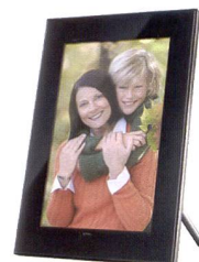
Les cadres photos Sony détectent automatiquement leur orientation.

peut notamment être affichée à côté de la photo. Les cadres offrent une grande liberté dans les formats d'image: V700 et V900 prennent en charge les fichiers JPEG, TIFF et BMP. 512 Mo sont disponibles dans la mémoire interne. Le lecteur de car-