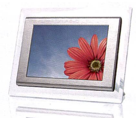
Le cadre Jobo s'utilise aussi avec des batteries.

Hama propose aussi une gamme de cadres photo. Le nouveau modèle 10,2 pouces est fourni avec trois cadres interchangeables en acrylique (argent, noir) et bois (brun foncé) pour personnaliser le produit à sa guise ou changer de décor. Les fichiers photo sont directement importés et restitués depuis la carte mémoire (lecteur de carte pour cartes mémoire courantes intégré) ou un support de données