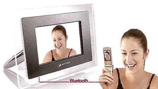
Particularité de l'Aiptek Monet BT: transmission par bluetooth.

Aiptek a coutume d'utiliser le nom de grands peintres pour baptiser ses cadres photo numériques. Nous nous sommes penchés sur l'Aiptek Monet BT présenté à la CeBit. La particularité du Monet BT est son récepteur Bluetooth intégré qui le transforme en support de lecture pour les clichés photo pris sur téléphone portable ou assistant personnel. Les photos peuvent