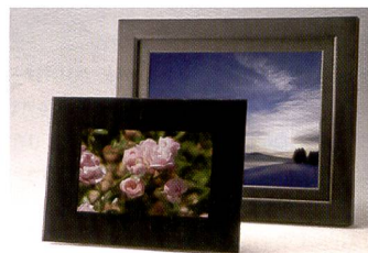
Les cadres numériques Braun sont proposés en 10,2 et 15 pouces.

saturation se règlent directement. La taille de l'écran du Braun DigiFrame 1500 entraîne un poids relativement élevé de presque trois kilos. Mais avec un bon clou, le cadre restera bien accroché.