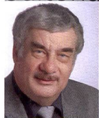
Urs Tillmanns Photographe, journaliste spécialisé et éditeur de Fotointern