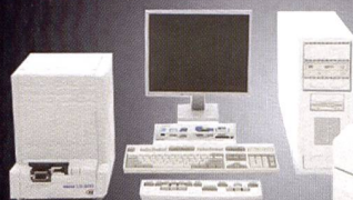
QSS 37 - Series Qualité, rapidité et polyvalence