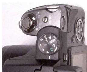
Nikon P80: construction compacte et utilisation conviviale.

Le Sony Cybershot DSC-H50 est un tout nouvel appareil qui se situe cependant avec son zoom optique 15 fois dans la gamme inférieure des appareils à superzoom tout en étant malgré tout un peu plus performant que ce qu'on pouvait imaginer il y a peu de temps encore de la part d'un compact. La plage de zoom du H50 ne débute qu'à 31 mm, et non pas à 26 ou 27 comme chez ses concurrents. L'objectif Carl