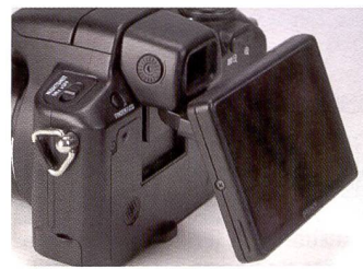
Particularité du Sony H50: l'écran orientable vers le haut et le bas.

lors de la sélection manuelle de l'ouverture du diaphragme et de la vitesse d'obturation. Alors que sur le Nikon P80 par exemple, ces