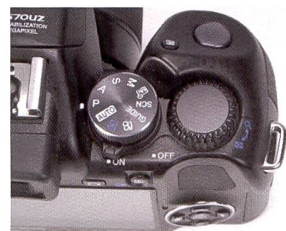
L'Olympus SP-570 UZ s'utilise presque comme un reflex numérique.

manuels. L'image perçue à travers le viseur (électronique) est grande et claire. On remarquera le grand écran de 2,7 pouces