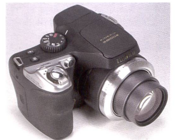
Le Fujifilm S8100fd est alimenté par des piles AA.

ge de trépied. Les revêtements caoutchoutés assurent une préhension sûre. Le S8100fd se distingue par un bourrelet imposant, incontournable compte tenu des quatre piles AA à loger. Pour les réglages manuels (ouverture du diaphragme et vitesse d'obturation), le photographe n'a à sa disposition que la bascule multifonction qui trône à l'arrière. Il y aurait certainement eu des solutions plus confortables.