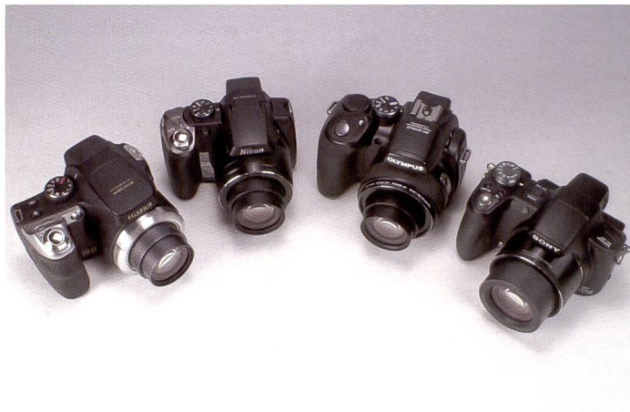
Les quatre appareils photos dotés d'un zoom optique 15x – ou plus – sur le banc d'essai. Les plages focales sont impressionnantes, mais qu'en est-il du reste de l'appareil? Les stabilisateurs d'images sont-ils à la hauteur?

Devant un vertigineux zoom optique 20x, on est vite tenté de penser qu'il y a anguille sous roche! Quelques zooms «monstrueux» se sont soumis à notre test et ont plutôt bien tiré leur épingle du jeu. En définitive, l'appareil parfait en toutes situations existe-t-il ou n'est-il qu'une chimère?