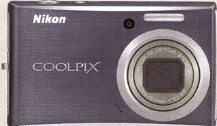
Le Coolpix 610c (en haut) a un temps de démarrage très court. Le Coolpix S710: 14,5 mio. de pixels et plage de sensibilité extensible jusqu'à 12 800 ISO.