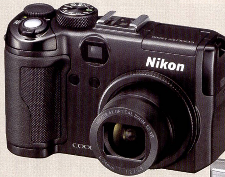
Le nouveau Nikon Coolpix P6000 avec GPS intégré et zoom 4x.