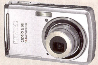
Le Pentax Optio E60 a été revisité pour séduire le marché. Ci-dessous: l'Optio M60, avec prise de vue en rafale à grande vitesse (5 mio. de pixels)