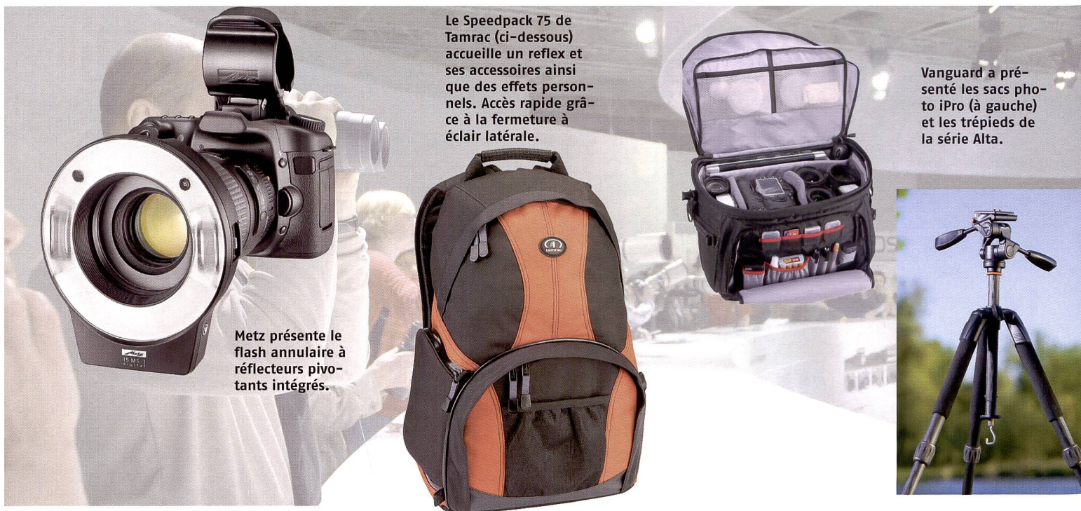
Le Speedpack 75 de Tamrac (ci-dessous) accueille un reflex et ses accessoires ainsi que des effets personnels. Accès rapide grâce à la fermeture à éclair latérale.

Erno lance Alta de Vanguard, une nouvelle gamme économique de trépieds. La colonne centrale est dotée d'une bague antichoc amortissant toute descente intempestive du mécanisme. L'extrémité inférieure de la