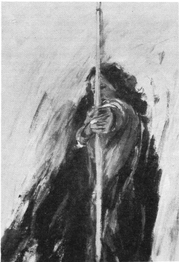
Bilder von Bignia Corradini

Mit diesem Artikel habe ich versucht, einen Teil dessen, was für mich Feminismus bedeutet, aufzuschreiben. Dass ich dabei vieles nicht genügend ausformuliert habe, dass ich auf vieles überhaupt nicht eingegangen bin, Esther