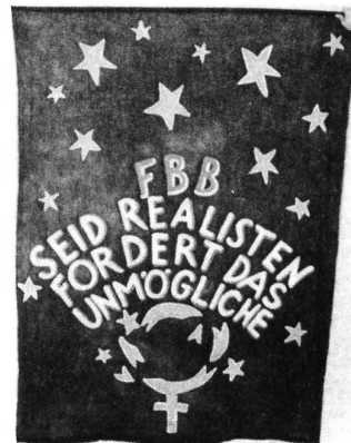
Abb. 1,2,3, zur Fristenlösung, Dispersion auf farbigem Fahnenstoff. ca. 170 x 200