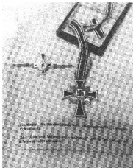
Goldenes Mutterverdienstkreuz, Amtskreuz, Leibgedinge Privatbesitz Das "Goldene Mutterverdienstkreuz" wurde bei Geburt des achten Kindes verliehen.

In der ersten Nachkriegs- und Aufbauzeit zeigten die Frauen Selbständigkeit und Stärke. Die Männer waren in der Minderzahl, tot oder in Gefangenschaft. Aber dann schlug das Pendel wieder völlig in die