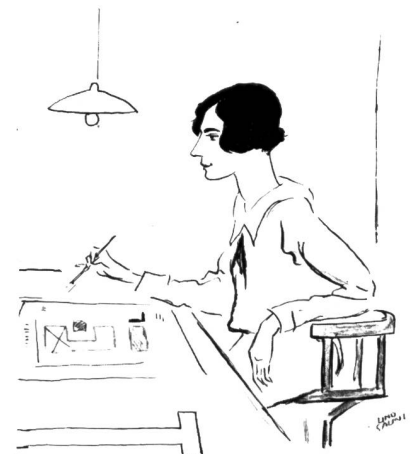
DIE ERSTE FRANKFURTER ARCHITECTIN AUF DEM HOCHSARAHNT.