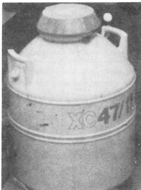
Ein Tank voll gefrorenes Sperma im Fenway Center in Boston