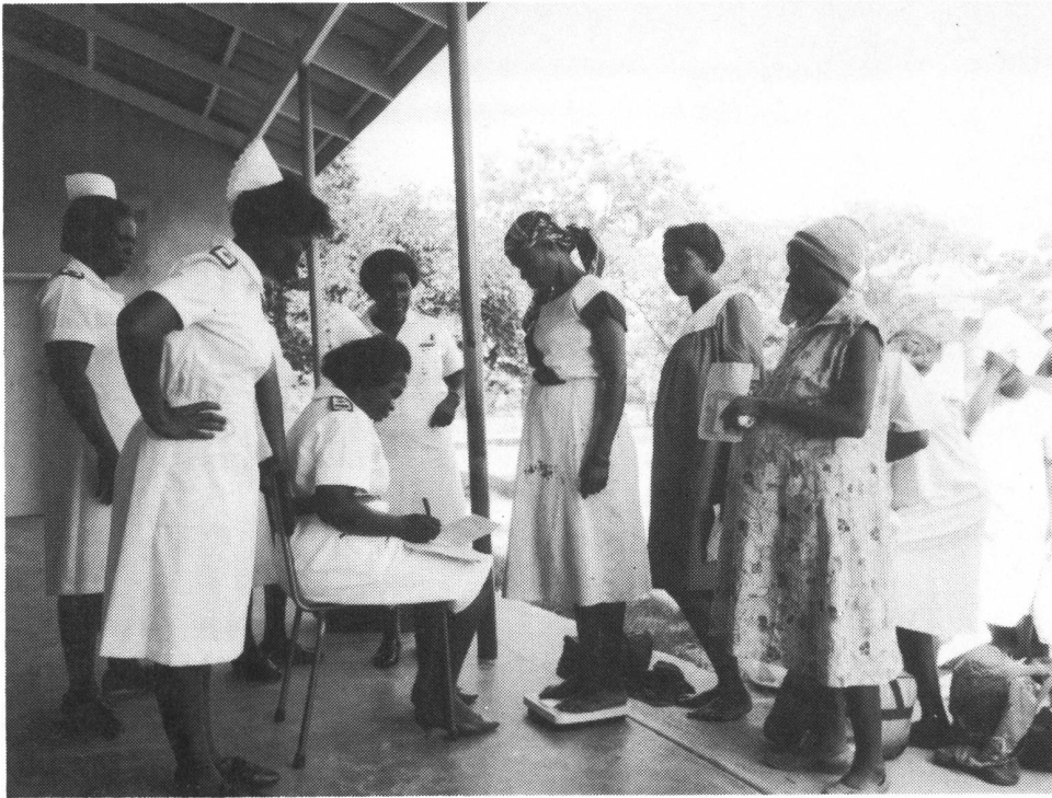
Schwangere Frauen bei der Vorsorgeuntersuchung: Rund 130 Frauen kommen jeden Mittwoch ins Missionsspital St. Theresa. Seit die Spitäler Gebühren verlangen müssen, kommen viele nicht mehr oder erst, wenn es zu spät ist.

trotzdem entschieden für 125 US-Dollars pro Nacht zwei Nächte in der «Hwange Safari Lodge» zu logieren. An der hoteleigenen künstlichen Wasserstelle sollen sich allabendlich viele Tiere versammeln. Heftige Regenfälle vereiteln jedoch dieses Privileg. Der Regen, der jetzt meine paar Urlaubstage zu verderben droht, ist von der hiesigen Bevölkerung sehlichst erwartet worden. Aufrufe zum Wassersparen begegnen mir, ausser im Luxushotel, auf Schritt und Tritt.