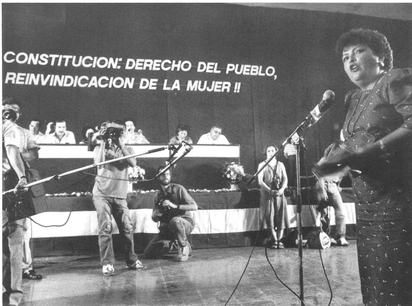
Während der Vernehmlassungssitzung zu einem neuen Verfassungsvorschlag unter den Sandinisten. Managua, Nicaragua, 10. Juni 1986.