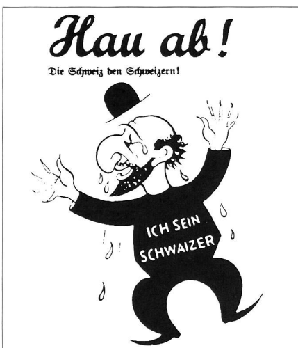
In den 30er und 40er Jahren wurden solch antisemitischen Karikaturen eines «Ostjuden» – wie MigrantInnen und Flüchtlinge aus dem östlichen Europa verächtlich genannt wurden – häufig publiziert.

Eine extrem restriktive Einbürgerungspraxis hielt den ausländischen Anteil hoch, was wiederum Anlass zu Angriffen auf die solchermaßen Ausgegrenzten bot. Es war eine neue Variante des mittlerweile klassischen Teufels-