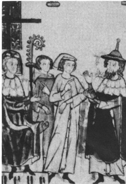
Die Abbildung aus der Manessischen Liederhandschrift zeigt (am rechten Bildrand) Süßkind von Trimberg, den einzigen bekannten jüdischen Dichter mittelhochdeutscher Sprache. Auch Süßkind, der doch wohl eine bevorzugte Stellung einnahm, trug den diskriminierenden Judenhut.

So führte beispielsweise die Pest 1348/49 zur Gefangennahme zahlreicher Jüdinnen und Juden im Schloss Chillon. Die Herrschenden liessen sie foltern, um ihnen Geständnisse abzuringen: Sie hätten Quellen und Brunnen vergiftet und so die Pest verbreitet. Die Mär von der Brunnenvergiftung wurde rasch und gezielt in Umlauf gebracht. Herrschende wurden zum Teil angeschrieben