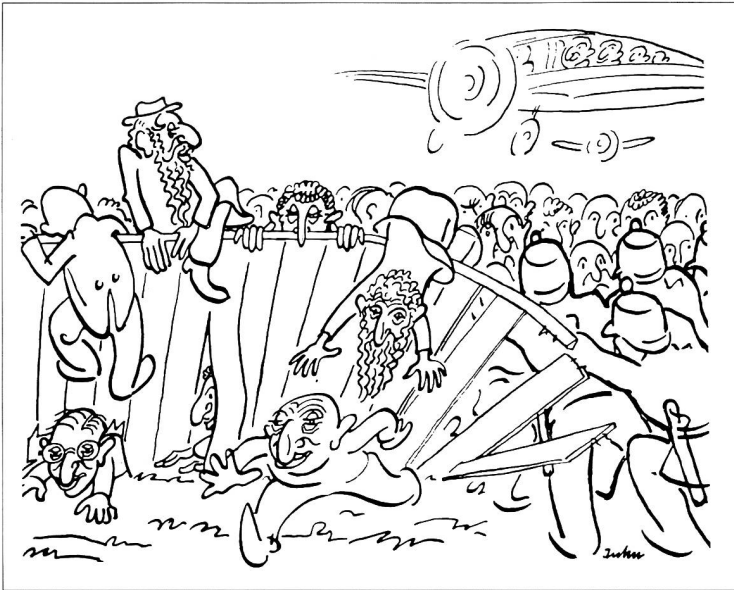
Nach dem Anschluss Österreichs an Hitlerdeutschland versuchten 1938 u. a. viele jüdische ÖsterreicherInnen vor den Nazis in die Schweiz zu flüchten. Daraufhin veranlassten die Schweizer Behörden, dass die Nazis Pässe von Jüdinnen und Juden mit einem «J-Stempel» kennzeichneten. In dieser antisemitischen Karrikatur der Zeitung «Schweizer Volk» (Nr. 24, 1938) kommt die abweisende Haltung gegenüber den jüdischen Flüchtlingen zum Ausdruck.

kreises. Jüdinnen und Juden wurden in vielen Bereichen diskriminiert, und dann wurde ihnen ihr «Anderssein» so zum Vorwurf gemacht, als sei dies ihre freie Entscheidung. Befürwortet wurden Bürgerrechtsgesuche am ehesten bei Personen, die sich durch Austritte aus den Gemeinden oder durch Mischehen aus Sicht der Behörden genügend vom Judentum distanziert hatten.