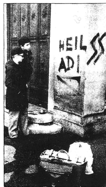
Im März 1979 wurde ein Bombenanschlag auf die Synagoge an der Zürcher Freiestrasse verübt. Die Bombenleger verschmierten zudem – wie eine Woche zuvor beim jüdischen Gemeindehaus – die Wände mit Hakenkreuzen und SS-Zeichen. Die Täter wollten damit gegen die Ausstrahlung des Filmes «Holocaust» am Schweizer Fernsehen protestieren.

Eine (selbst-)kritische Auseinandersetzung mit alten und neuen Formen der Vorurteile und Diskriminierungen hat bis heute nicht stattgefunden. Jüdinnen und Juden, die eine Diskussion einfordern, sehen sich in aller Regel mit alten Vorurteilen konfrontiert: Vom jüdischen Kapital, von der jüdischen Dominanz im Medienbereich, vom internationalen Judentum ist dann gleich die Rede. Wer sich daran stört, wird als überempfindlich bezeichnet. Verwüstungen von jüdischen Friedhöfen werden als Lausbubenstreiche abgetan, Hakenkreuzschmierereien, anonyme Drohungen und die Leugnung von Auschwitz als die Verirrungen weniger Ewiggestriger verharmlost. Und obschon sich 45 Prozent der Stimmbe-