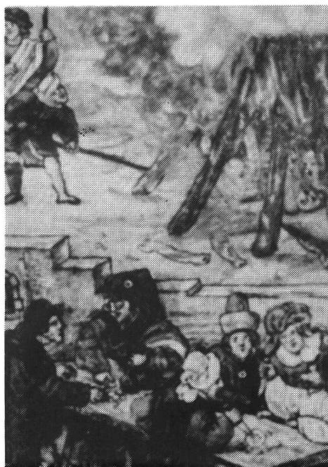
Diese Darstellung aus der Luzerner Chronik des Diebold Schilling zeigt ein jüdenfeindliches Greueltreiben. In der deutschen Stadt Sternberg soll ein Priester den Juden für Geld geweihte Hostie überlassen haben, die diese zum Spott mit Messern traktierten. Die Hostie begann zu bluten. Als der angebliche Frevel ruchbar wurde, wurden die Juden der Stadt gemartert und dann verbrannt. Die Darstellung zeigt vorne die Frevelszene, im Hintergrund die Verbrennung.

Die französische Revolution hatte den Jüdinnen und Juden in weiten Teilen Europas rasch eine vorübergehende Verbesserung ihrer rechtlichen Lage gebracht, die Napoleon 1808 jedoch rückgängig machte. Während in der Zeit nach 1848 im Ausland die rechtliche Emanzipation der Jüdinnen und Juden aber doch wieder rasche Fortschritte machte, zeigten sich hierzulande die meisten Kantone unnachgiebig restriktiv.