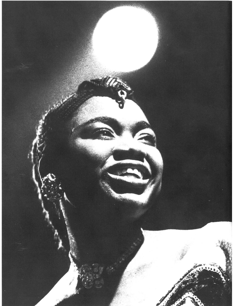
Oumou Sangare während eines Konzertes.

Islamische Patriarchen und konservative ältere Frauen waren erzürnt über die offenerherzige Kritik der Liedermacherin und ihre Darstellung alternativer Lebensformen. Doch von jungen malischen Frauen und Männern wurde Oumou Sangare zu ihrem eigenen