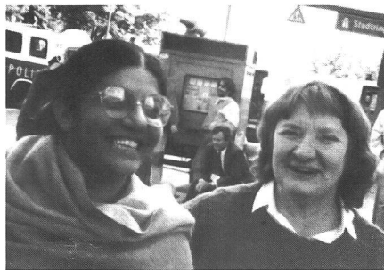
Vandana Shiva und Maria Mies an der Demo während des Weltbank-Gipfels in Berlin, 1988.

Diesen und ähnlichen Fragen gehen die zwei renommierten Ökofeministinnen Maria Mies und Vandana Shiva in ihrem Buch «Ökofeminismus» nach, das neu auf deutsch erschienen ist. Das Buch ist eine Sammlung von überarbeiteten Vor-