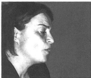
Herausgegeben von Rosmarie Kurz und Chudi Bürgi