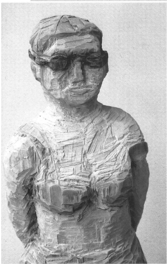
Holzskulptur von Susan Schoch