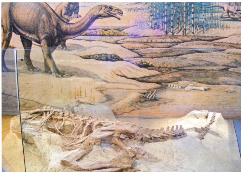
Vollständiges Skelett eines Plateosaurus in Fundlage, ausgestellt vor «seinem» Lebensbild.

der Buchreihe «FRICK – Gestern und Heute» aus dem Jahr 1985.