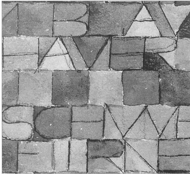
Abb. 2: Paul Klee, »Einst dem Grau der Nacht enttaucht...«, 1918.17, Detail von Abb. 1.

Die beiden aquarellierten Blätter sind in quadratische Felder unterteilt, und zwar scheint die Unterteilung allein durch die Kontrastwirkung der nebeneinanderliegenden Farben zu geschehen. Ein Farbton macht ein Feld aus. So gesehen ist das Werk von 1918 eine reine Farb-Komposition, vergleichbar mit den vier Jahre früher entstandenen tunesischen Aquarellen sowie den späteren sogenannten Quadratbildern. Der Vergleich stimmt jedoch nur in bezug auf die optische Erscheinung der Kompositionen; was den Bildaufbau betrifft, unterscheidet sich unser Blatt von beiden Werkgruppen. 33 Nicht die Farbe ist verantwortlich für die Aufteilung der Fläche, sondern ein anderes Gestaltungselement.