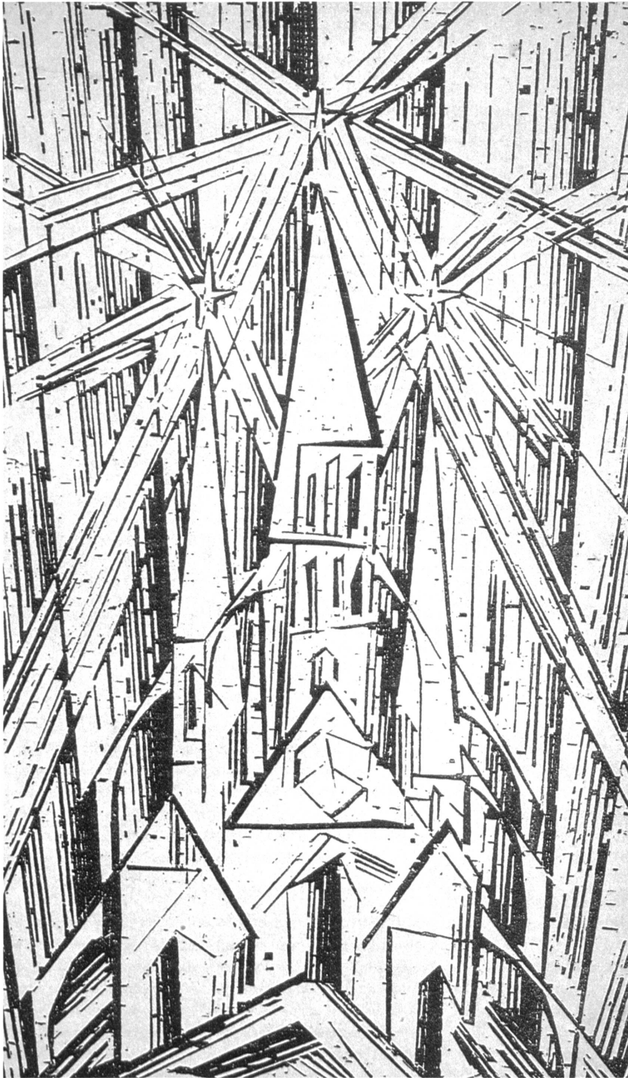
Abb. 1: Lyonel Feininger, „Kathedrale“, 1919, Holzschnitt, Titelblatt für das „Manifest und Programm des Staatlichen Bauhauses“.