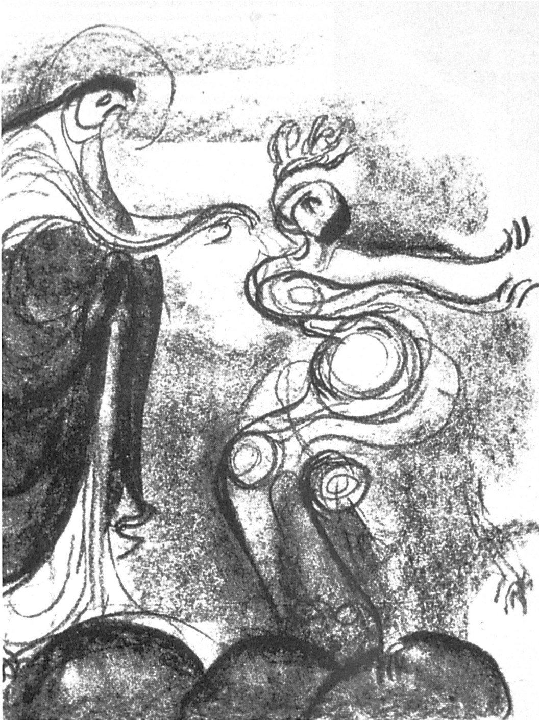
Abb. 4: Ima Breusing, Bildanalyse nach einer Miniatur aus dem Evangeliar Ottos III., 1921/22, Berlin, Bauhaus-Archiv.