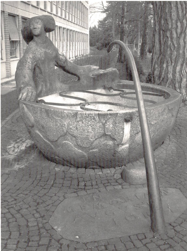
Abb. 16: Paul Speck, »Forel-Brunnen«, 1946–1949, Granit und Bronze, 210×260×235cm, Zürich, Unispital.