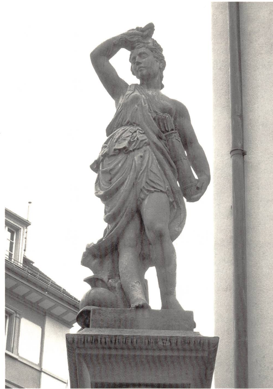
Abb. 13a, 13b: Anonymus, »Verwundete Amazone« (Kopie), 1748/49, Kalkstein, 168cm, Zürich, Rennweg.

sprach im Zusammenhang mit dem Schutzengel von »Sauglattismus« 158 und die Architektin Trix Haussmann von »horror vacui« 159 .