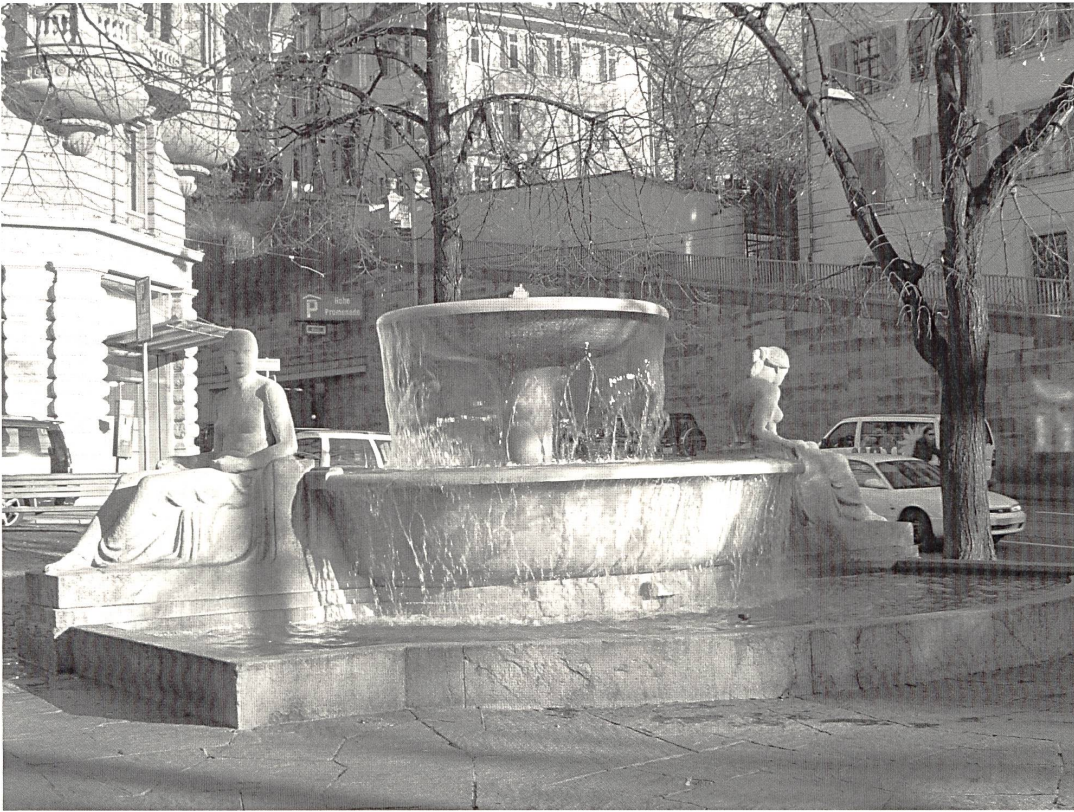
Abb. 15: Eduard Zimmermann, »Rämibrunnen«, 1935, Othmarsinger Muschelkalk, 220×750×700cm, Zürich, Rämipost.

Drehung auf der linken, deren Schwanzflosse sie berührt. Diese wiederum wendet ihr den auf die Hand gestützten Kopf zu und scheint die Gespielin zu betrachten. Die Wasserwesen halten sich grazil bei der Hand. Die schwingvollen Formen ihrer Körper suggerieren Bewegung und scheinen, unterstützt durch den Sprudel, der von den drei Düsen verursacht wird, einen Wirbel zu bilden. Die Oberfläche erscheint wie von Wind und Wasser abgeschliffen, so dass Gesichtszüge fast nicht erkennbar sind. Die abstrahierende Formentendenz Lienhards, dessen Schaffen als »gemäßigt modern« 205 beschrieben werden kann, kündigte sich in diesem Grossauftrag, einem Hauptwerk des Winterthurer Künstlers, erst an. 206