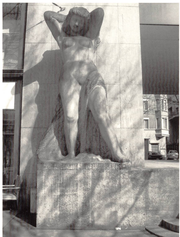
Abb. 7: Walter Scheuermann, »Erwachen«, 1934–1936, Porphyrgranit, 400×218×175cm, Zürich, Kantonales Verwaltungsgebäude Walche.