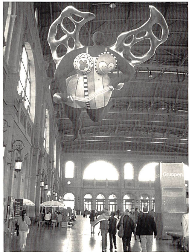
Abb. 12: Niki de Saint Phalle, »L'ange protecteur«, 1997, Aluminium, Kunststoff, Acrylfarben, Blattgold, Neonlichtband, 1100 cm, Zürich, Hauptbahnhof Zürich.

Die Tatsache, dass kurz vor Ende des 20. Jahrhunderts eine von einer Künstlerin geschaffene Frau, die ein Mutterbild reproduziert, in den Hauptbahnhof – ein Knotenpunkt der ehemals männlich dominierten Wirtschafts- und Verkehrsmacht – 156 einzieht, kann unterschiedlich gedeutet werden. Je nach Blickwinkel wird hier ein antiquiertes oder ein spirituelles, urtümliches Frauenbild transportiert. Auf die Enthüllung des bunten Engels folgten zahlreiche Diskussionen, in denen Bedenken betreffend Qualität und Platzierung der monumentalen Plastik geäussert wurden. 157 Vor allem Architektur- und Kunstfachleute distanzieren sich von dem Werk. Urs Widmer, der Präsident des Vereins »Kunst im Hauptbahnhof Zürich«