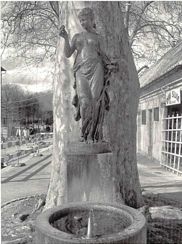
Abb. 5: Anonymus, »Flora«, 1886, bronzierter Grauguss, 165×80×46 cm, Zürich, Eingang Platzspitz-Park.

Strassenbaus auf den von Emil Schäfer gestalteten Trinkbrunnen beim Eingang zum Platzspitz-Park weichen. 83 Das Attribut der Blumen macht die in antikisierendes Gewand gekleidete Figur als »Flora« identifizierbar, die italische Göttin der Blumen und Blüten und Personifikation des Früchte spendenden Erdbodens. 84 Die Allegorie der Natur wird meist, wie auch hier, als blumengeschmückte Jungfrau dargestellt. 85 Die »Flora« ist somit eine Manifestation des Stereotyps »blühendes Mädchen«. Ihre liebliche Erscheinung und Bedeutung prädestiniert sie dafür, als gefällige Massenware Brunnen zu schmücken. So krönt auch an der Ecke Bederstrasse/Waffenplatzstrasse eine ähnliche Flora den Brunnen im Engequartier. 86 Die »Helvetia«, die im Folgenden besprochen wird, weist als Allegorie des Nationalstaates einen abstrakteren Grad der zu versinnbildlichenden Inhalte auf.