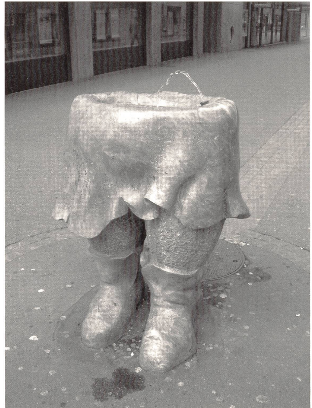
Abb. 17: Peter Meister, »Brunnewibli« (Kopie), 1986, Duquesa Kalkstein, 120×104×70cm, Zürich, Uraniastrasse/Lintheschergasse.

Hier wurden, um auf ein Naturschauspiel, nämlich die Vereinigung zweier Flüsse, zu verweisen, weibliche Figuren benutzt. Dafür wählte der Künstler eine Form der Weiblichkeitsimagination, die sowohl die Nähe zur Natur als auch einen bedrohlichen und wilden Aspekt beinhaltet. 213 Die aus einem Stein gehauenen Figuren scheinen ineinander überzufließen und symbolisieren damit die Strudel und Strömungen, die beim Zusammentreffen zweier Flüsse entstehen. Ein Wirbel im Wasser stellt, genau wie die Wasserfrauen, eine tödliche Gefahr dar. Der Gesamteindruck ist jedoch wenig bedrohlich, eher wirken die beiden verspielt und ineinander versunken. Gefahr vermittelt die Skulptur höchstens durch die Verführungskunst der rechten Figur, die sich anmutig gedreht dem Betrachter anzubieten scheint. Hier findet weniger die Männer mordende Femme fatale des Jugendstils ihren Ausdruck, als eine der den Wasserfrauen zugeschriebenen positiven Eigenschaften aus der Reihe ihrer seit jeher disparaten Charakteristika: Die Nixen sind vom Künstler als Personifikationen der Flüsse intendiert, könnten also auch als eine Allegorie der Flüsse beziehungsweise des Wassers als Lebensspender gelesen werden.