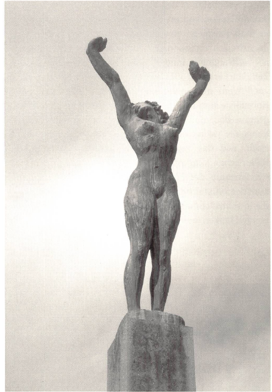
Abb. 11a, 11b: Hermann Haller, »Mädchen mit erhobenen Armen«, 1939, Bronze, 461×191×92cm, Zürich, Landiwiese.

bei und beschreibt den »Reiz der Heimlichkeit« mit der Taktik des »Sich-Abwendens« bei gleichzeitiger flüchtiger Zuwendung. 137