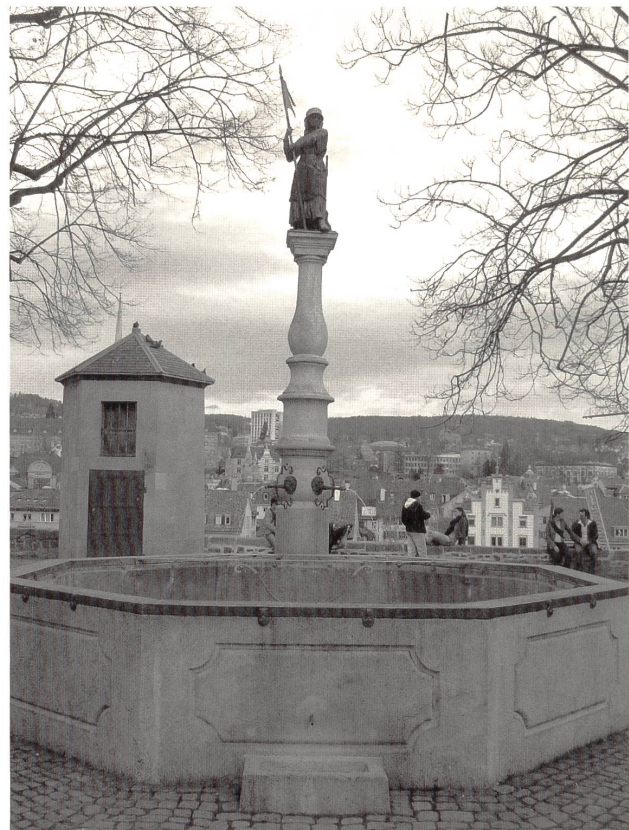
Abb. 2: Gustav Siber, »Standbild einer wehrhaften Zürcherin«, 1912, Bronze, 145cm, Zürich, Lindenhof.

Häufig wird der die Plastik umgebende Raum nicht nur als physische und ästhetische Gegebenheit, sondern auch in Bezug auf seine Bedeutung in die künstlerische Planung miteinbezogen und ist somit ein entscheidender Faktor bei der Schaffung einer Plastik für den Aussenraum. Ein Beispiel, das die Bedeutung des Standortes und die Auswirkungen eines Ortswechsels auf die Rezeption und Bedeutung einer Plastik besonders gut illustriert, ist die Doppelfigur »Die Begrüssung« des Bildhauers Otto Kappeler, 17 an der Ecke Florhofgasse/Hirschengraben (Abb. 1). 18 Die überlebensgrossen Frauen aus rotem Muschelkalk stehen leicht gestaffelt hintereinander und blicken in dieselbe Richtung. Das halbnackte Paar unterscheidet sich kaum in Körperbau, Frisur und Ausdruck. Die starre Mimik wirkt ernst und die Blicke scheinen auf ein fernes Ziel oder ins Leere gerichtet. Die linke Hand der hinteren Figur ruht auf der linken Schulter der vorderen, die sich an die Brust fasst. Mit der freien Hand halten beide jeweils ein knapp die Scham bedeckendes, hinabgeglittenes Tuch. Ihre Erscheinung wirkt trotz der Nacktheit wenig aufreizend, denn der breite Nacken und die stark ausgebildete Bauchmuskulatur lässt die Frauen grob und keineswegs elegant oder erotisch wirken. Trotz einer schwachen Betonung von Stand- und Spielbein bilden sie eine blockhafte Einheit.