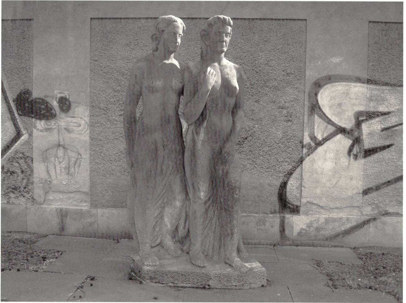
Abb. 1: Otto Kappeler, -Die Begrüssung-, 1939, Muschelkalk, 250×142×61cm, Zürich, Ecke Florhofgasse/Hirschengraben.