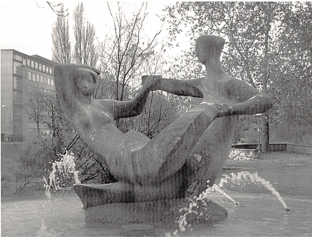
Abb. 14: Robert Lienhard, »Vereinigung der Flüsse Sihl und Limmat«, auch »Brunnenfigur«, »Wirbel- oder »Nixen«, 1953–1955, Castione-Granit, 290×300×140 cm, Zürich, Platzspitz.