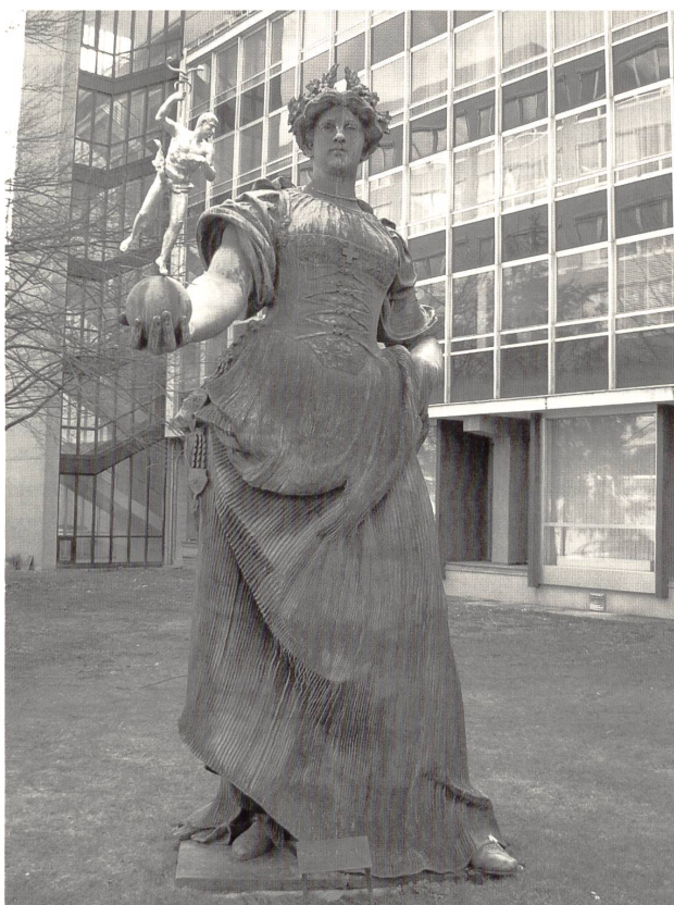
Abb. 6: Richard Kissling, »Helvetia«, 1899–1901, Bronze, 390cm, Uster, Zellweger LuwaAG.

Das Gewicht der massigen, weit gegrätscht stehenden Frau scheint auf dem hinteren Bein zu ruhen. Das Knie desselben ist jedoch leicht gebogen und lässt so die gesamte Körperhaltung unrealistisch erscheinen. Über die mächtigen Schenkel erhebt sich ein