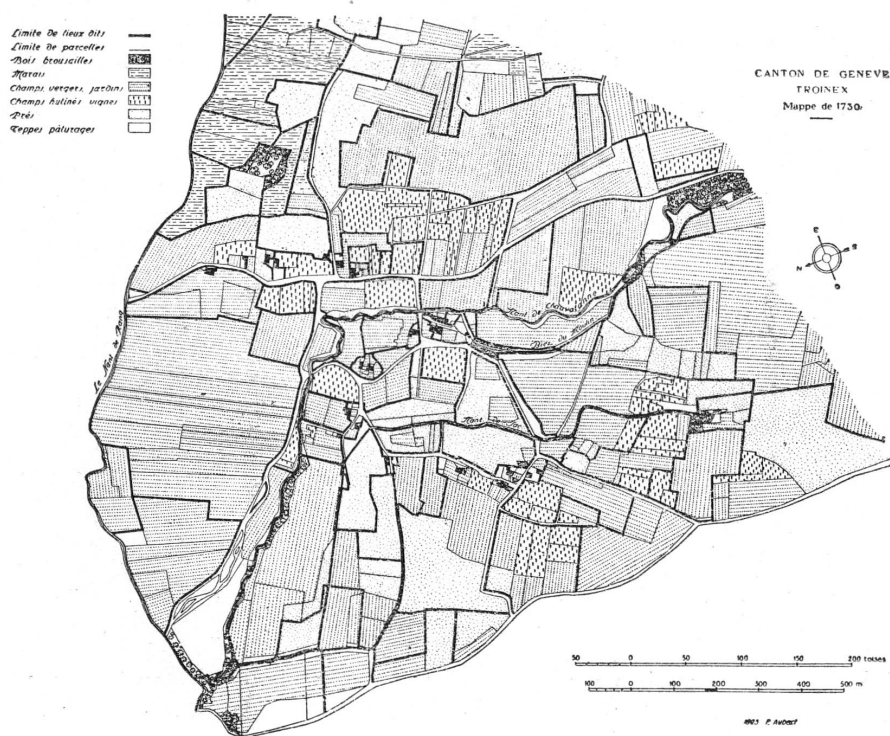
FIG. 6. — Troinex. Les cultures. 1730.

(« crosses »). Ce mélange de cultures est encore en honneur dans la Savoie et une partie de l'Italie. Entre les ceps, on cultivait les céréales et parfois des légumes, courges et haricots; puis, dès le XVIII me siècle, les pommes de terre. A ces divers produits, on adjoignait aussi des arbres fruitiers, par exemple des pêchers, des pommiers et des cerisiers 1 . Dans les « terres hutinées » l'impôt de la taille était dû uniquement sur les céréales et, suivant qu'il s'agissait de froment ou de seigle, on payait la taxe afférente à ces produits. Voici ce que nous avons retrouvé dans le registre de Bernex, à propos des « terres hutinées ». « Ayant égard que la dime ne retombe que