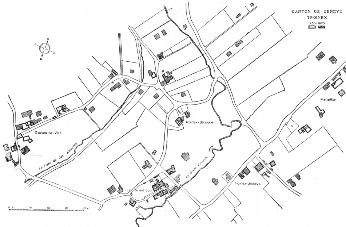
FIG. 2. — Troinex, 1730-1923.

Afin de donner une vue d'ensemble de la région, nous n'avons pas voulu nous limiter au seul village de Troinex. Dans la carte à petite échelle ( fig. 3 ), figurent aussi les agglomérations de Bossey, Crevin et Evordes, telles qu'elles existaient au XVIII e siècle.