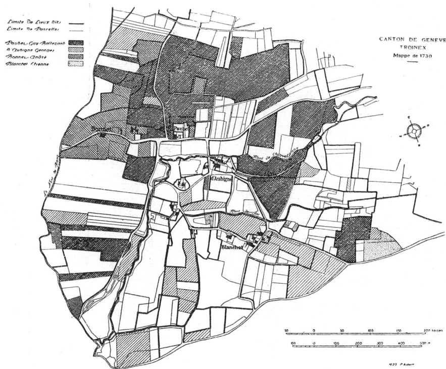
FIG. 5. — Troinex. Les propriétés agricoles. 1730.

Nous avons fait figurer sur un plan spécial ( fig. 6 ) l'état, en 1730, des différentes cultures en honneur à Troinex. Ce plan confirme ce que nous avons déjà remarqué sur la carte à petite échelle: les bois ont presque totalement disparu aux environs immédiats du village et les prés occupent une surface très réduite. Les marais, appelés aussi « prés-marais », n'étaient pas dépourvus de toute valeur; ils produi-