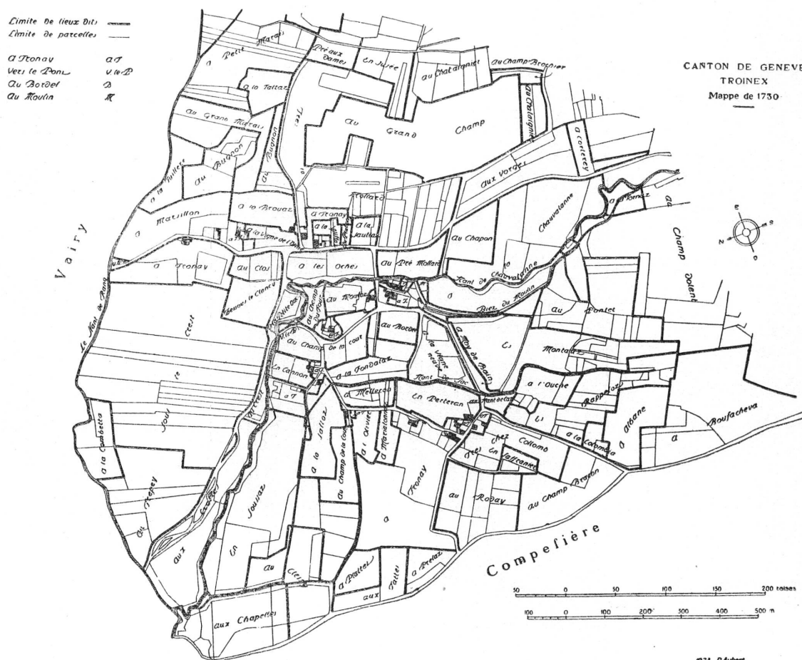
FIG. 4. — Troinex. Les lieux dits. 1730.