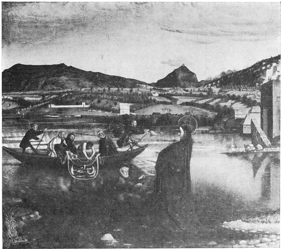
FIG. 4. — Retable de Conrad Witz. Musée de Genève. Détail : La pêche miraculeuse.

ville célèbre des Allobroges ou Savoisiens... ». Rien n'est plus vrai. Il n'est pas nécessaire de supposer à notre peintre de subtils desseins. A coup sûr il n'a pas voulu, par anticipation, prendre parti dans la querelle des zones, ni manifester son opinion au sujet de la destinée de Genève. Il n'est pas moins piquant de voir son œuvre apparaître dans l'iconographie genevoise au moment même où se célèbre le quatrième centenaire d'une première démarche vers les Suisses, car notre livre d'heures est un représentant authentique et indiscutable de l'orientation inverse, celle de la nature, opposée à la direction qu'ont préférée les hommes. Ainsi, témoin naïf du moyen âge, une modeste miniature, seule de son espèce parmi les innombrables vues de Genève, se charge de signification pour nous apparaître comme un vrai tableau d'histoire.