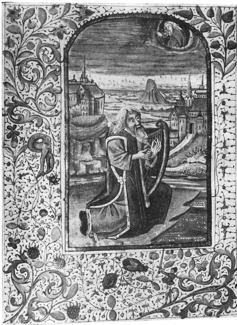
FIG. 1. — Livre d'Heures. Bibliothèque de Genève, ms. lat. 32 a.

éléments du tableau, on conviendra que, limitée par de hautes montagnes, la plaine où une rivière sinueuse coule au pied d'une sommité en forme de cône peut figurer