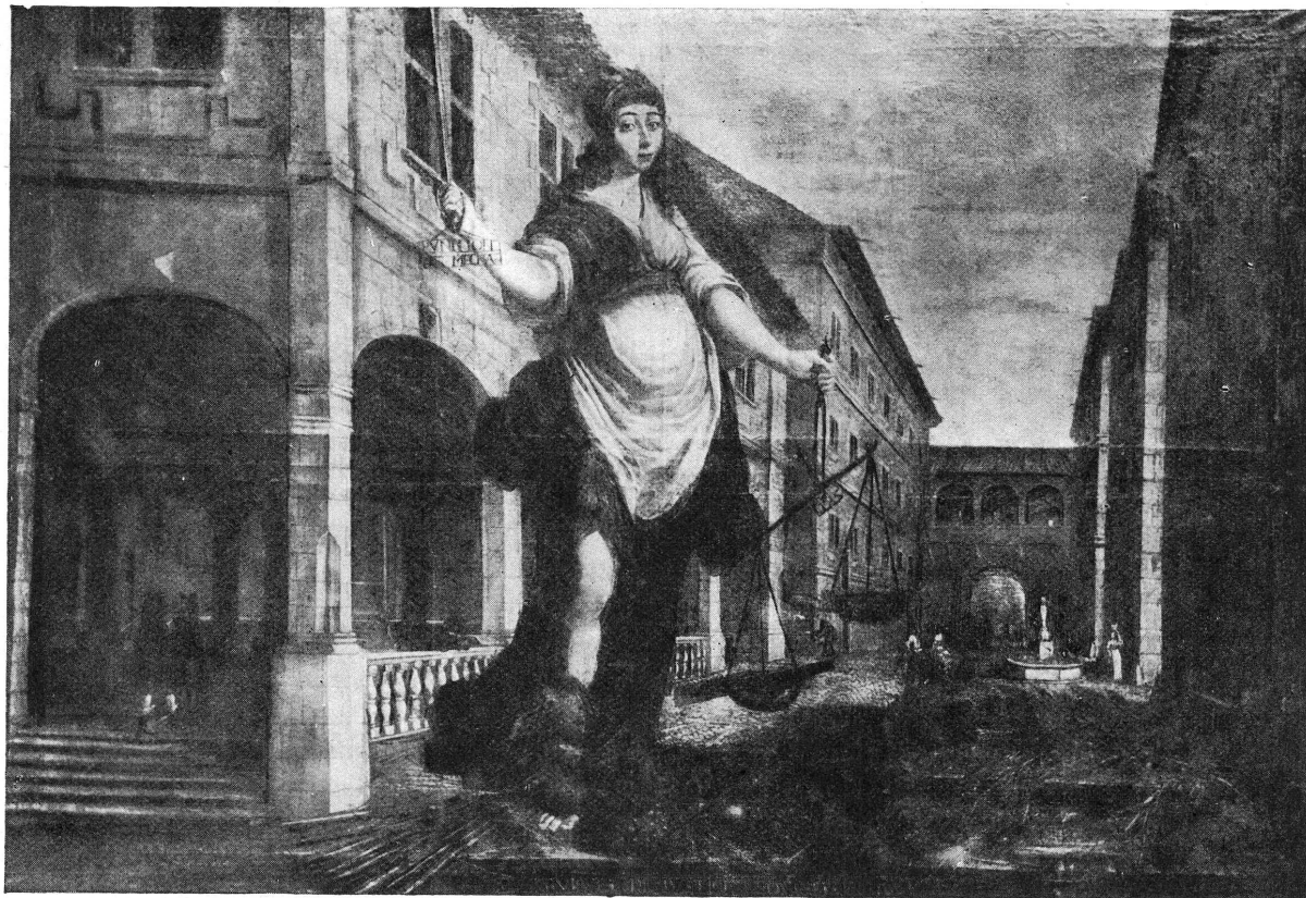
FIG. 1. — La Justice. Musée d'Art et d'Histoire, n° 501.

tous les édifices du XVII e siècle 1 . Voici une estampe de la collection Rigaud (Bibliothèque publique), « La Paix descendant du ciel le 10 février 1789 sur la République de Genève » : c'est la place de l'Hôtel de Ville avec l'ancien arsenal à droite, à gauche l'Hôtel de Ville, la fontaine au centre 2 . Voici celle de Geissler, « le Retour du Conseil général » tenu le 10 février 1789 3 ; voici la gravure de 1822 par Escuyer 4 .