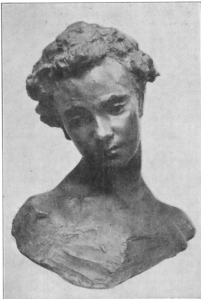
FIG. 1. — Rodó de Niederhäusern. Le Mal du pays.

Nous avons eu l'occasion de lire un grand nombre de ses lettres intimes. Elles ne fournissent pour ainsi dire pas de renseignement précis; aucune n'est datée. Mais elles font connaître l'homme. Rodó mêlait à des violences terribles une rare délicatesse de cœur que ses amis seuls ont pu apprécier. Rude, passionné, sensible, d'une énergie indomptable, respectueux à l'excès de son art, tel il apparaît dans sa correspondance qui reflète presque à chaque page les tourments dont il fut assailli sa vie entière. Trouver de l'argent pour payer ses modèles, ses pierres, ses fondeurs, ce fut là sa bataille journalière. Il accepta des besognes de toute espèce, mais ne consentit jamais à sacrifier son idéal. Ses réactions pendant