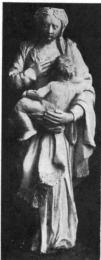
12305. — Ivoire. Statuette.

A l'exception de quelques objets de genres et d'époques divers, ce sont surtout des monuments de l'ancien art religieux des XII-XVII e siècle, et spécialement des ivoires sculptés, statuettes, feuillets de diptyques, etc. Si malheureusement un grand nombre de ces objets sont faux ou douteux, il en demeure qui ont une grande valeur artistique, et qui sont infiniment précieux pour nos collections encore peu abondantes en documents de ce genre.