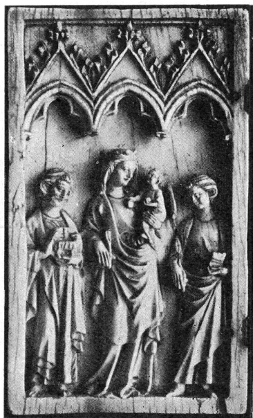
12260. — Ivoire. Feuillet gauche de diptyque.