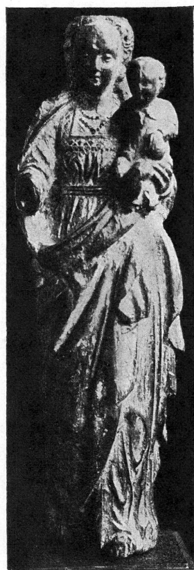
12306. — Bois doré. Statuette.