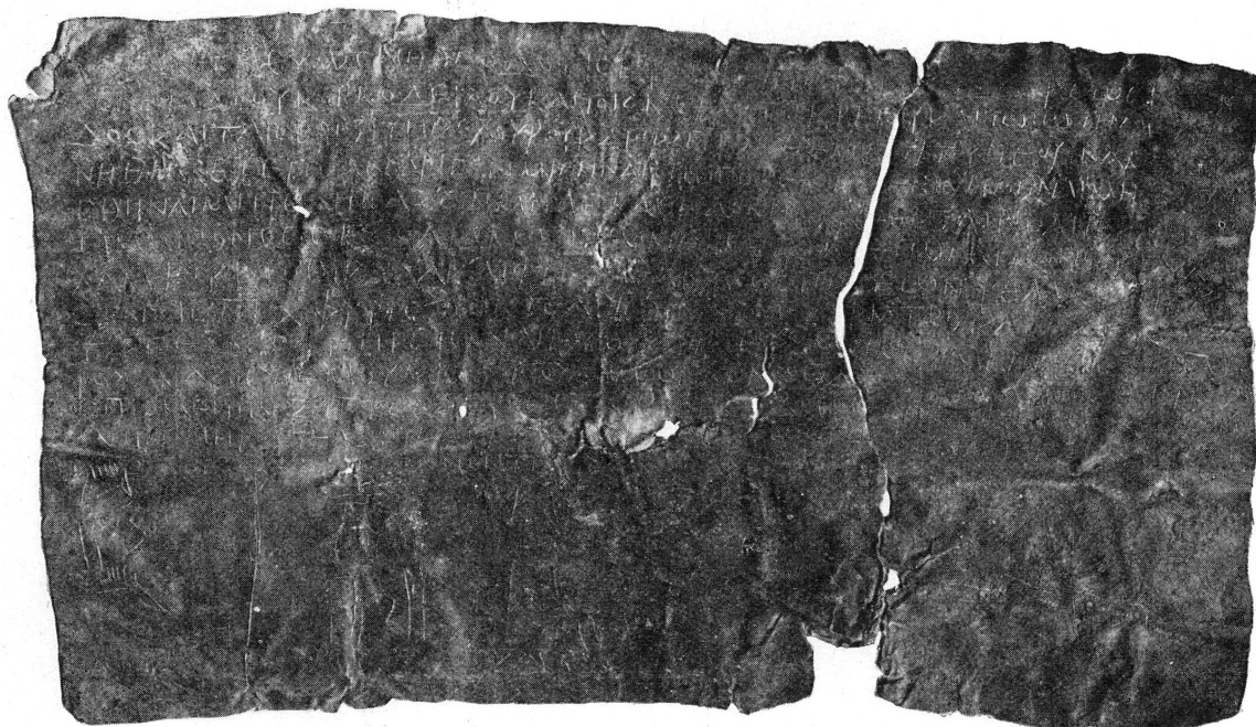
FIG. 1. — Tablette magique. Genève, Bibliothèque publique et universitaire.

C'est en application d'une recette analogue qu'a été gravée la tablette de plomb qui fait l'objet de cet article. Elle a été confectionnée pour un cas concret en suivant les indications d'un livre de magie qui, sans être identique au manuel cité, offrait