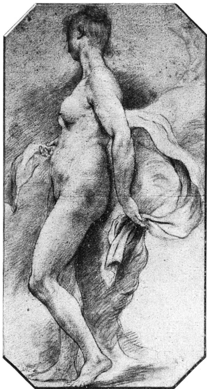
FIG. 1. — Charles-Joseph Natoire, Femme nue. (Musée d'Art et d'Histoire.)

tout au plus pourrait-on faire exception pour quelques plumes de STEFANO DELLA BELLA (1610-1644), disciple spirituel de Callot, et pour une sépia du décorateur G.-G. BIBIENA (1696-1756), Combat devant des ruines romaines , signé et daté de 1716. Ce ne sont pas les noms de CASOLANO, FARINATI, GALESTRUZZI, GRIMALDI ou PANNINI qui peuvent donner une idée, même lointaine, de l'art italien.