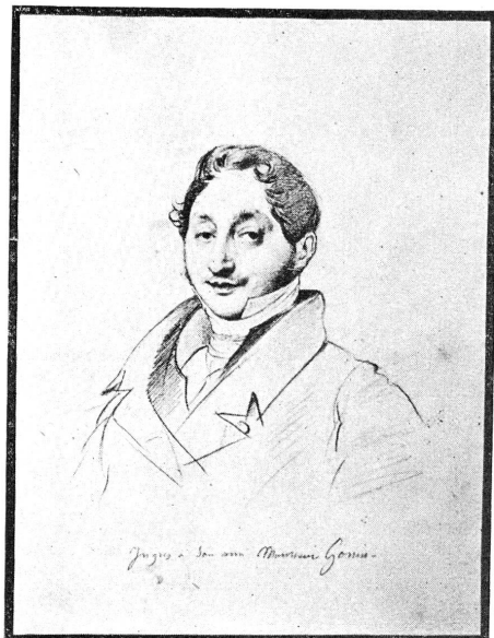
FIG. 3. — D. Ingres, Portrait de M. Gonin. (Musée d'Art et d'Histoire.)

INGRES figure au Musée de Genève avec quatre admirables portraits à la mine de plomb représentant des membres de la famille Gonin avec qui le peintre entretenait